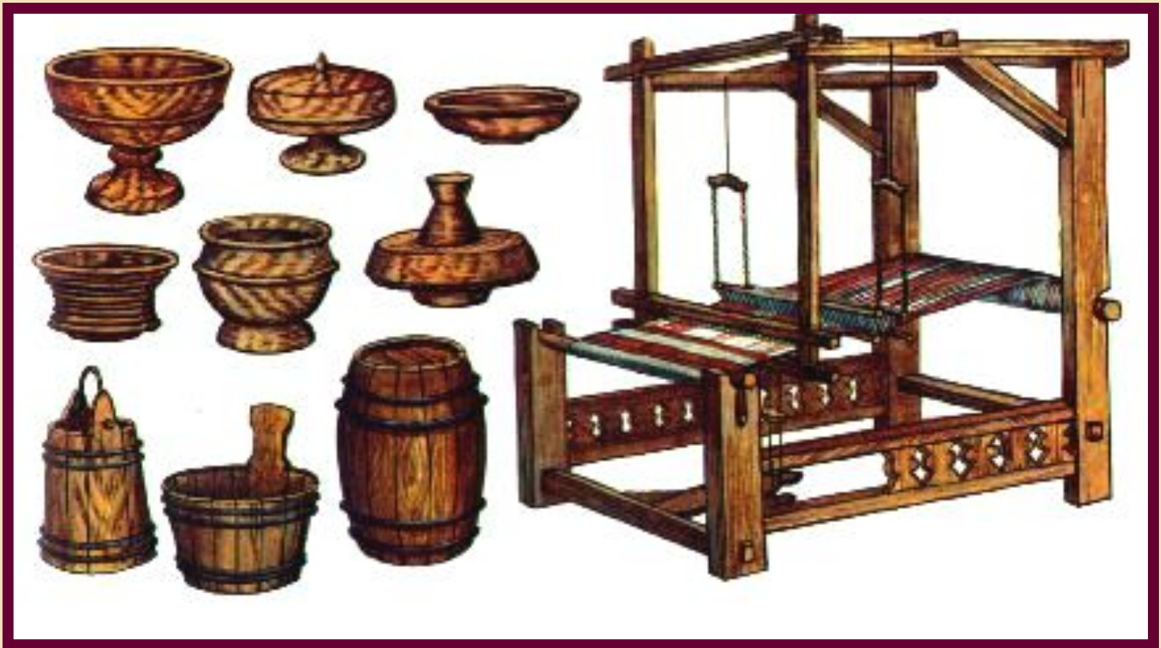
Ремесленные изделия мастеров XVII в.