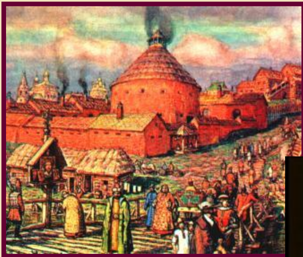
Васнецов А. М. Московский Пушечный двор в XVII веке.