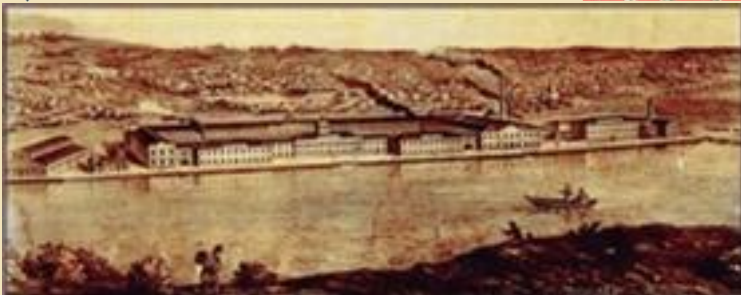
Металлургический завод Демидовых