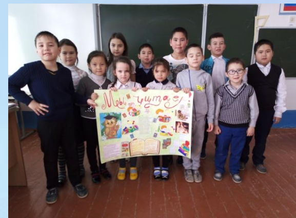
Проект «Время читать»