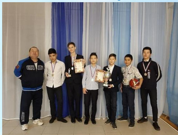
«Мы - друзья спорта»