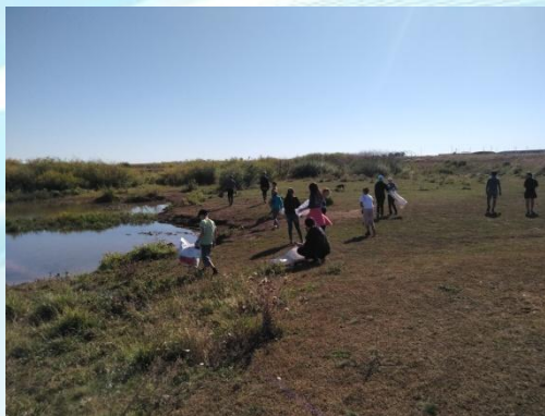
Акция «Чистое село»