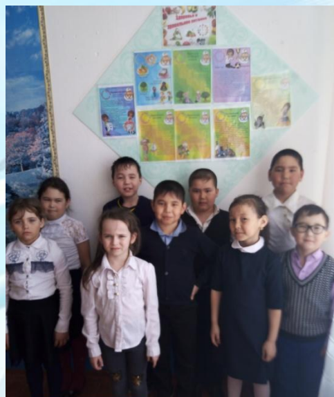
«Разговор о правильном питании»