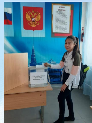
Областной детский референдум