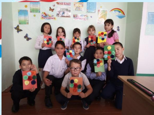
Открытки ко Дню пожилых людей