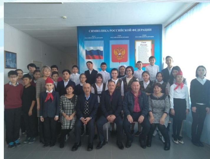
Встреча в воинами-афганцами