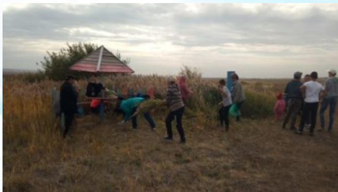
Акция «Чистый родник»