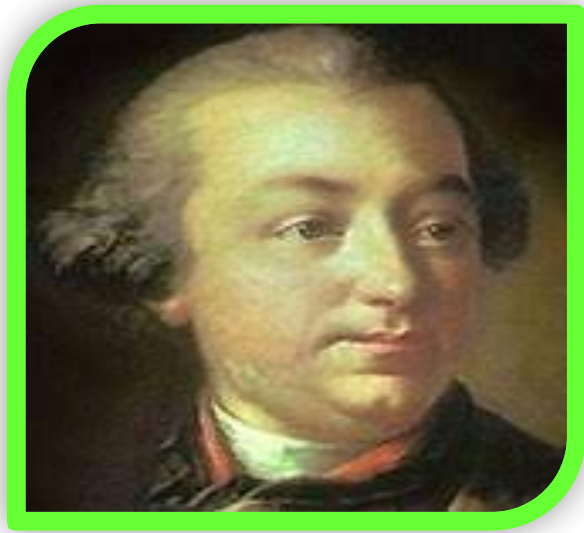
Антон Павлович Лосенко (1737—1773) — русский живописец.