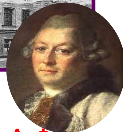
А.Ф. Кокоринов ректор и архитектор