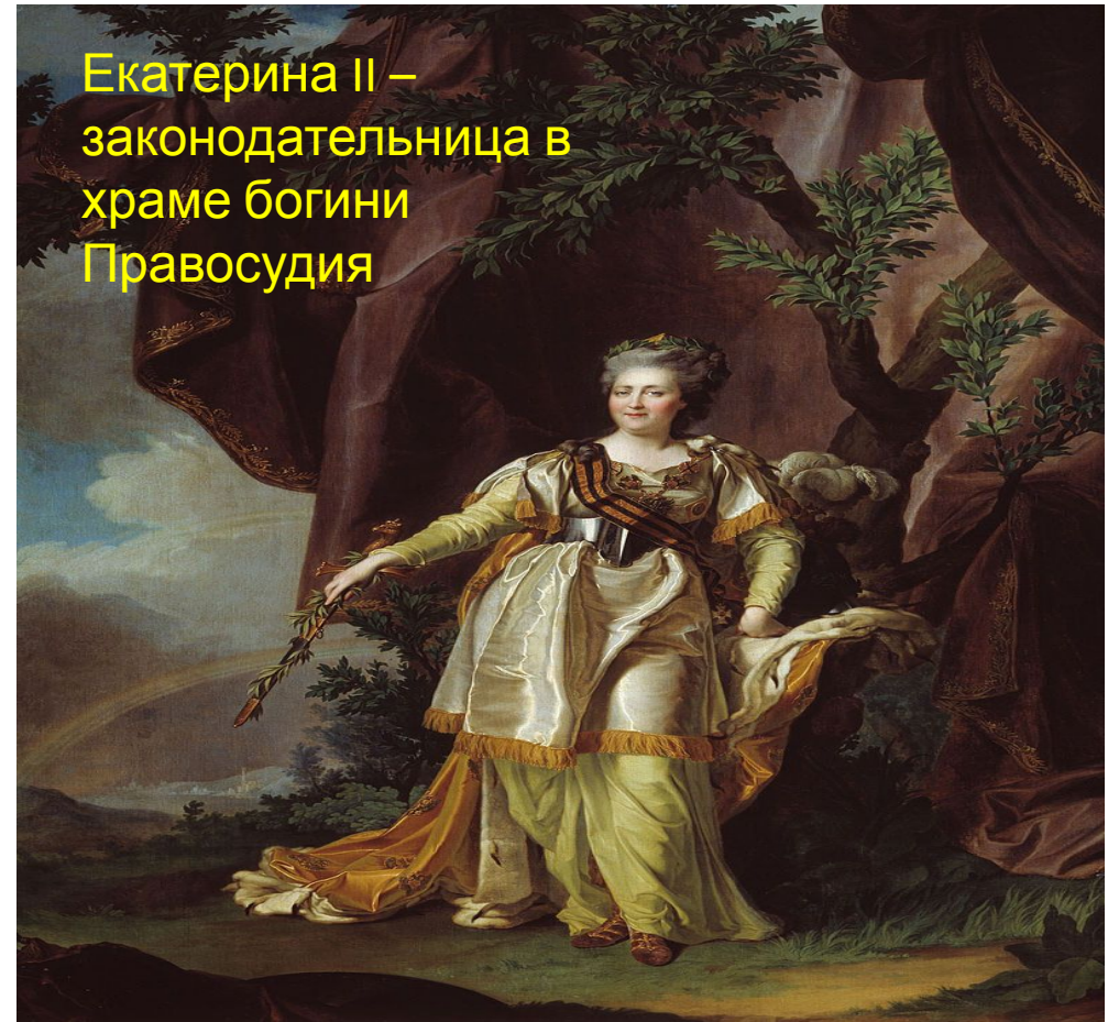
Екатерина II – законодательница в храме богини Правосудия