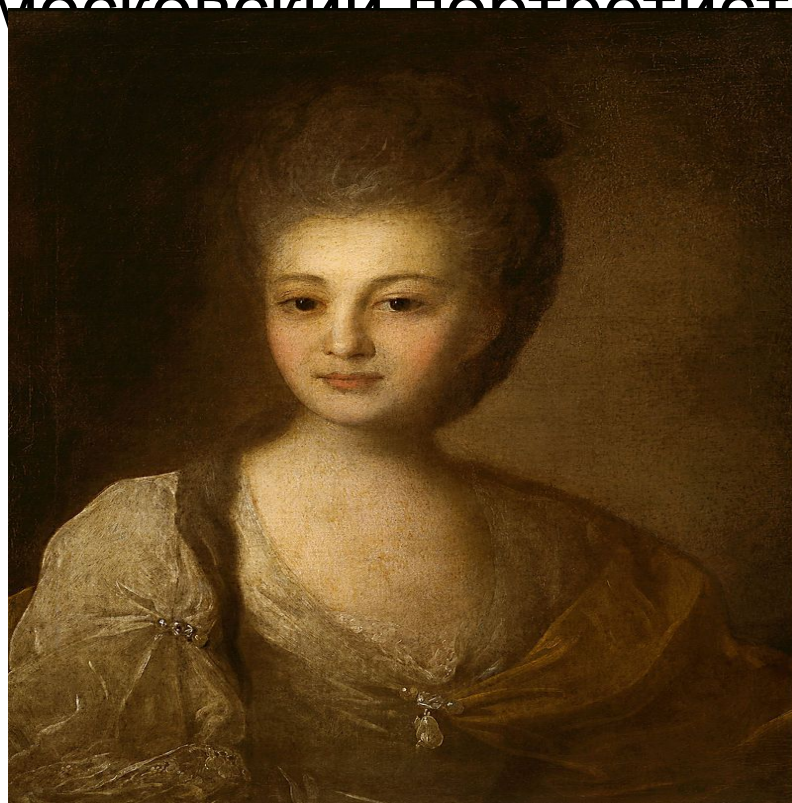
Портрет А. П. Струйской

Её глаза — как два тумана, Полуулыбка, полуплач, Её глаза — как два обмана, Покрытых мглою неудач. Соединенье двух загадок, Полувосторг, полуйспуг, Безумной нежности припадок, Предвосхищенье смертных мук.