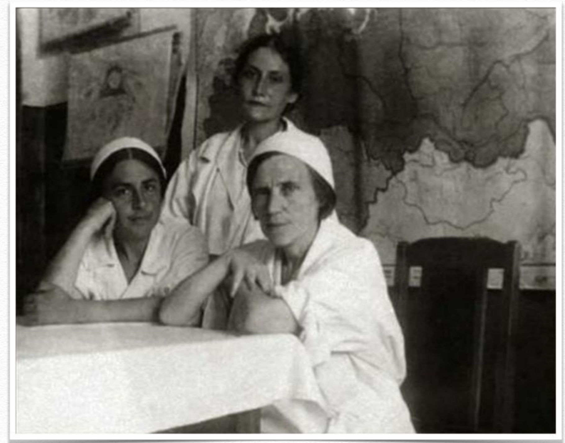
п. Кисегач, 1942

В 1943 Зейгарник вернулась в Москву и снова стала работать в ЦНИИ психиатрии в должности