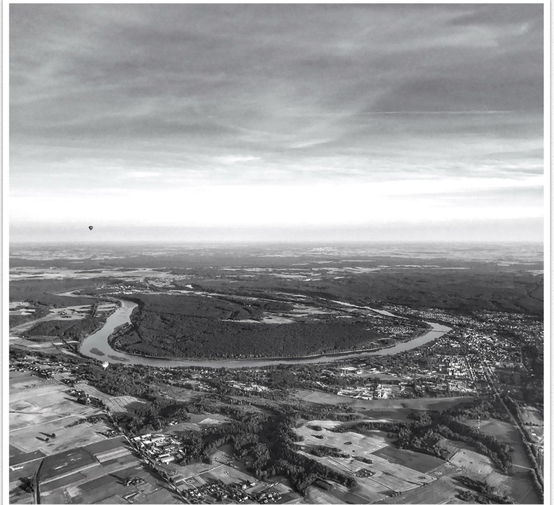
г. Пренай, Литва