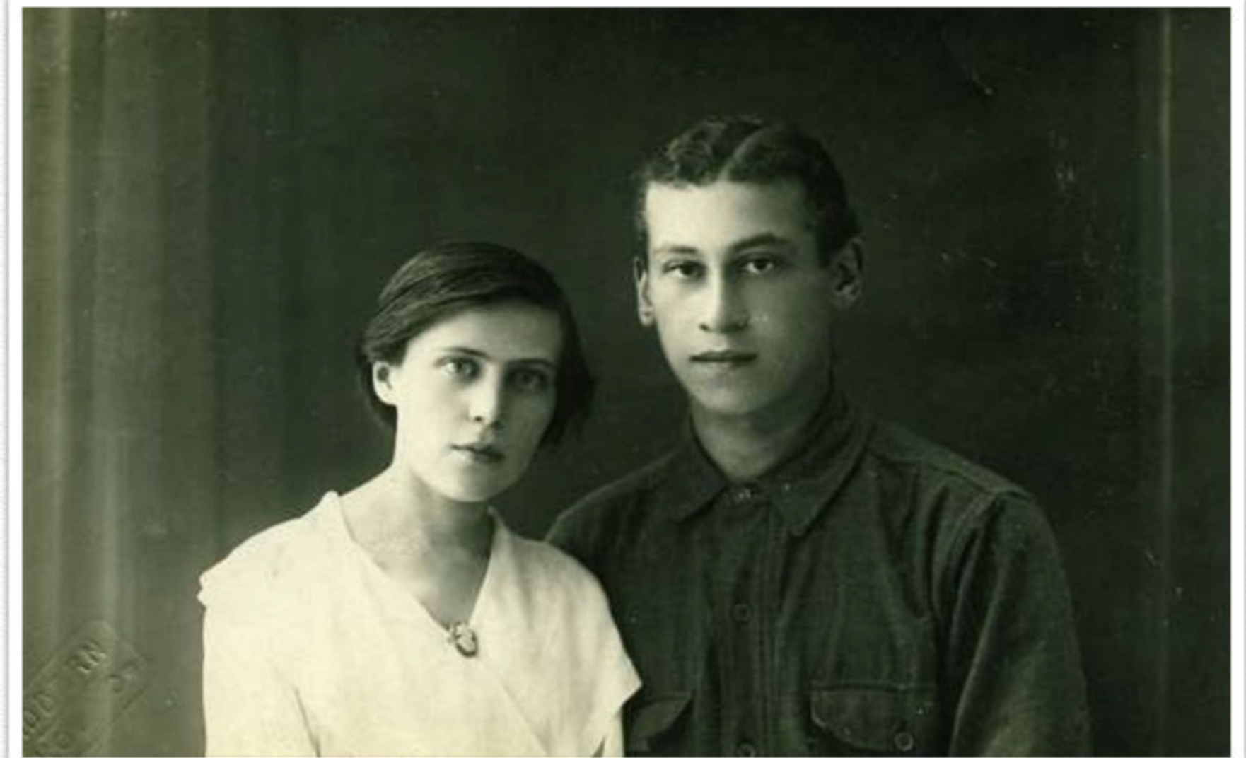
Перед переездом в Берлин, 1921 г.