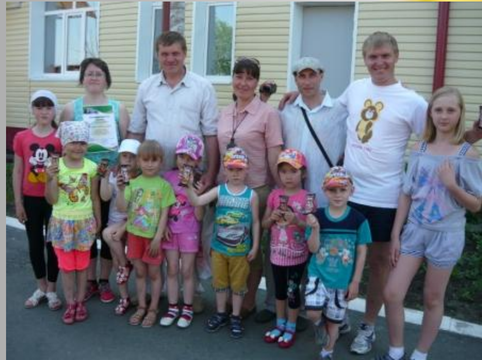
Сотрудники Белозерской спортивной школы