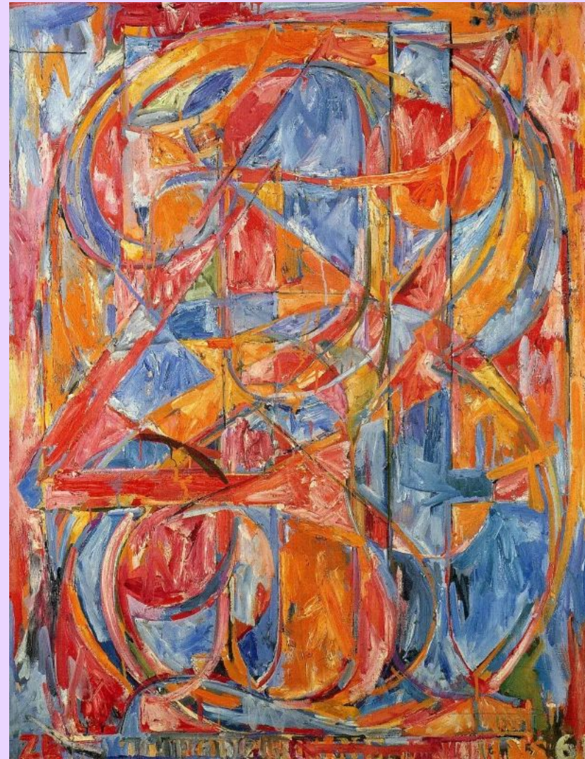
От 0 до 9 Джаспер Джонс Живопись, 1961

В отличие от процветающей Америки, Великобритания, где зародился поп-арт, тяжело переживала послевоенные годы. Можно сказать, что поп-арт обязан своим появлением завистливым взглядам через океан: на американскую массовую культуру, на идеализированные журнальные картинки беззаботной жизни общества потребления. Первыми к этим образам обратились художники из «Независимой группы», основанной в начале 1952 года. Они сформулировали и начали распространять большинство базовых идей британского поп-арта.