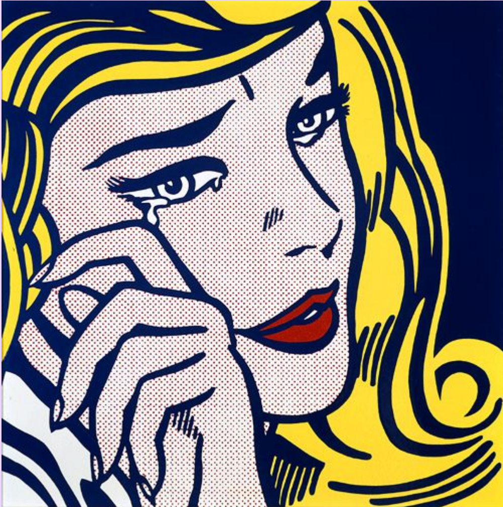
Плачущая девушка: 1964

Наиболее яркие формы американского поп-арта: — стилизованные репродукции комиксов Роя Лихтенштейна с использованием цветных точек и плоскостей, заполненных одним цветом;