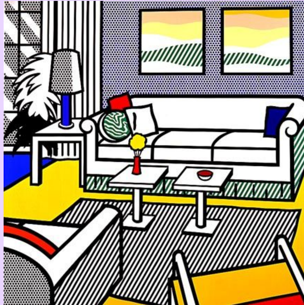
Интерьер со спокойными картинами 1991