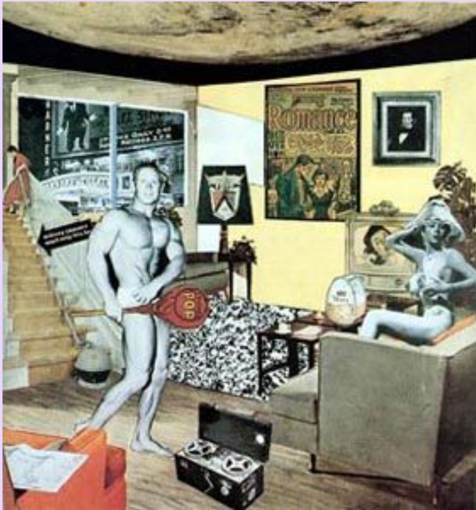
Ричард Гамильтон, «Что делает наши сегодняшние дома такими разными, такими привлекательными?» (1956) — одна из самых первых работ поп-арта

Одной из самых знаковых работ британского поп-арта считается знаменитый коллаж Ричарда Гамильтона под затейливым названием «Так что же делает наши сегодняшние дома такими разными, такими привлекательными?», созданный для важнейшей выставки «Независимой группы». Выставка «Это — завтра», прошедшая в Галерее Уайтчепел в Лондоне, стала отражением всепоглощающего интереса художников к массовой культуре. Как писал Аллоуэй, «...кино, научная фантастика, реклама, поп-музыка. Мы не испытываем к массовой культуре неприязни, распространенной среди интеллектуалов. Напротив, мы принимаем ее как факт, детально обсуждаем и с энтузиазмом потребляем».