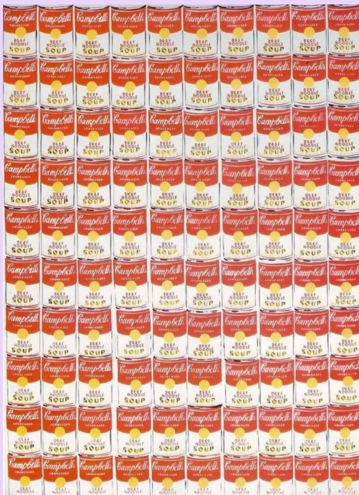
Сто банок с супом «Кэмпбелл» 1962

— буквально «вырезанные» из реальности картины и шелкографии Энди Уорхола с изображениями банок супа, коробок с мылом и бутылок «Кока-колы»;