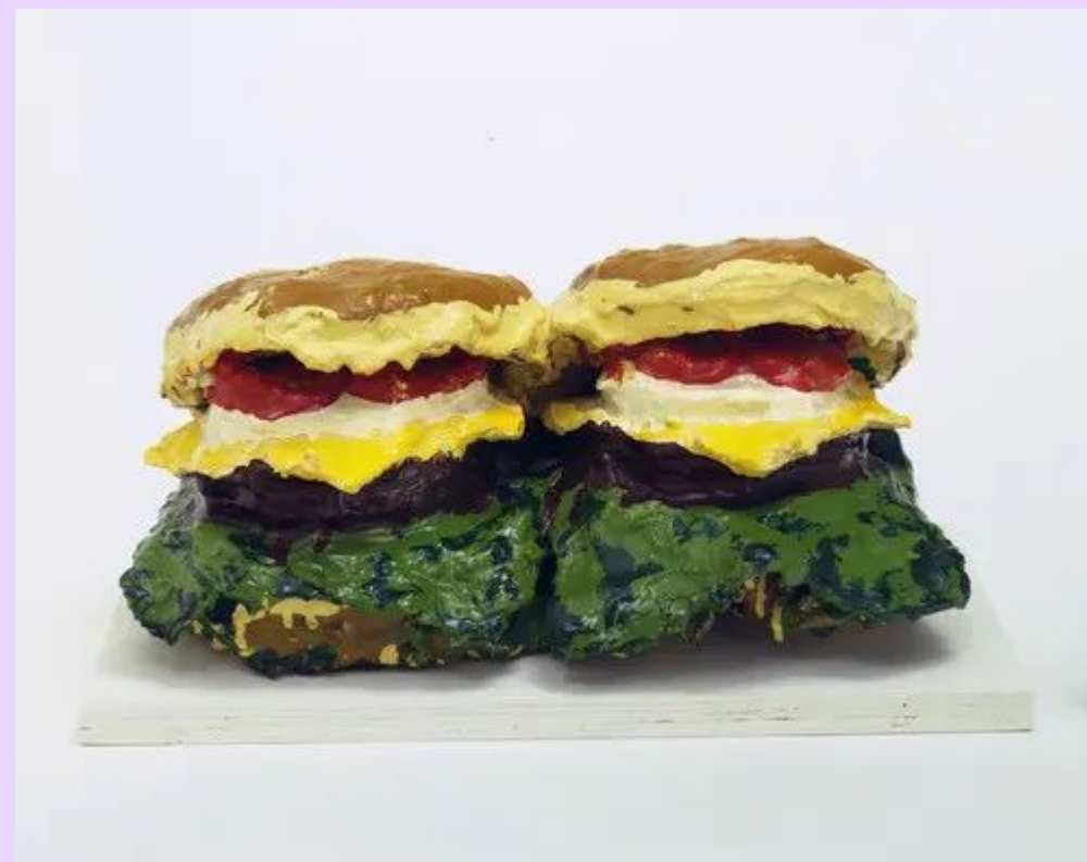
«Два чизбургера» 1962

— скульптуры Класа Олденбурга, увековечившие такие быденные вещи, как сантехника, печатные машинки и гамбургеры;