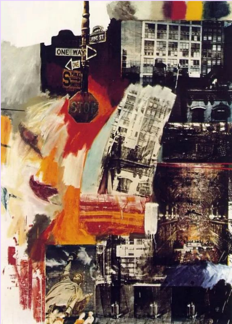
Имущество Роберт Раушенберг

После того, как Америка окончательно пришла в себя после Второй мировой войны, в стране начался мощнейший экономический подъем, что, в сочетании с прогрессом в области технологий и средств массовой информации, породило так называемую «культуру потребления». Культуру людей со стабильным высоким доходом и большим количеством свободного времени. Промышленность, расширившаяся и укрепившаяся за годы войны, теперь начала забрасывать массового потребителя самыми разнообразными продуктами, начиная от лаков для волос и стиральных машин, и заканчивая блестящими новенькими кабриолетами, которые, если верить рекламе, были материальным воплощением счастья. Существенной поддержкой для культуры потребления стало развитие телевидения и новые тенденции в печатной рекламе, где акцент стал делаться на графических изображениях и узнаваемых логотипах — брендах, которые сейчас в нашем визуальном насыщенном мире воспринимаются как нечто, само собой разумеющееся.