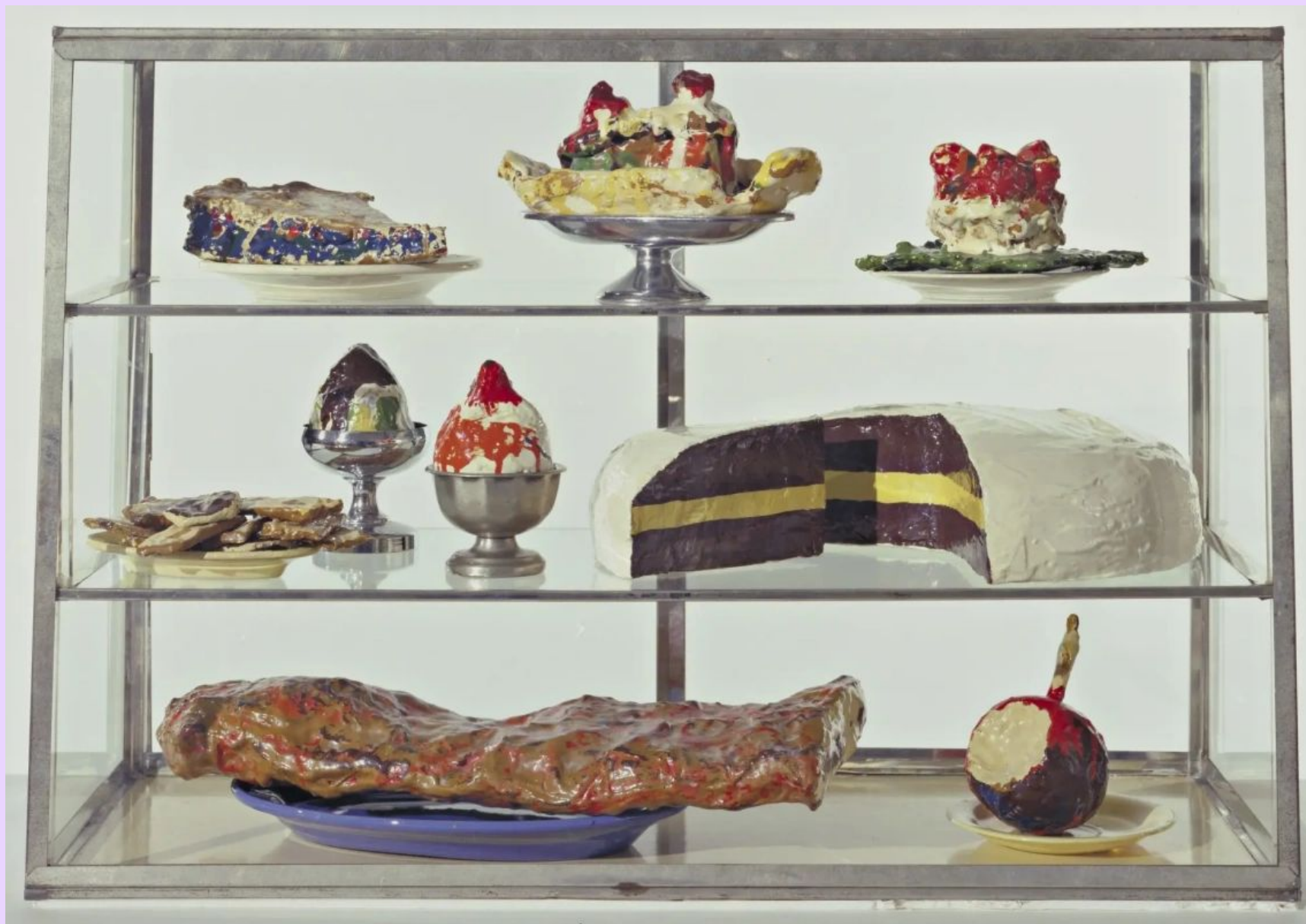
Витрина с пирожными Клас Олденбург 1962