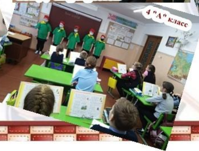
4 "А" класс