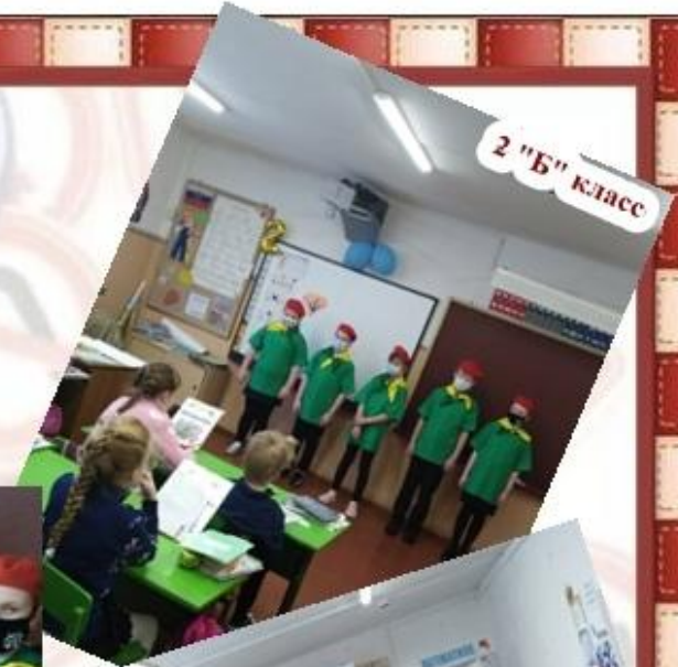
2 "Б" класс