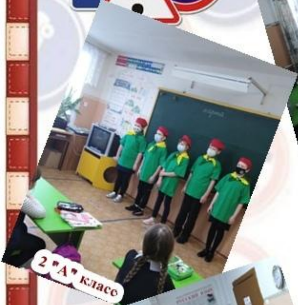
2 "А" класс