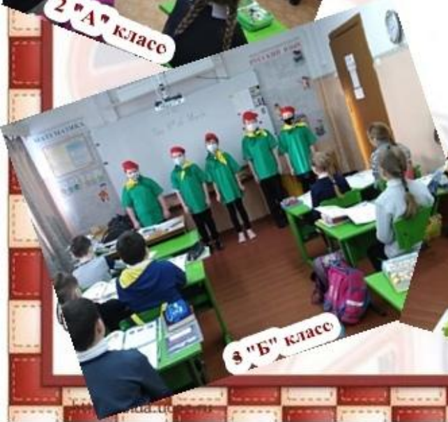
3 "Б" класс