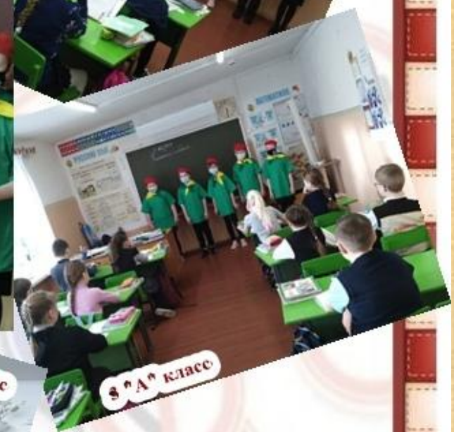
3 "А" класс