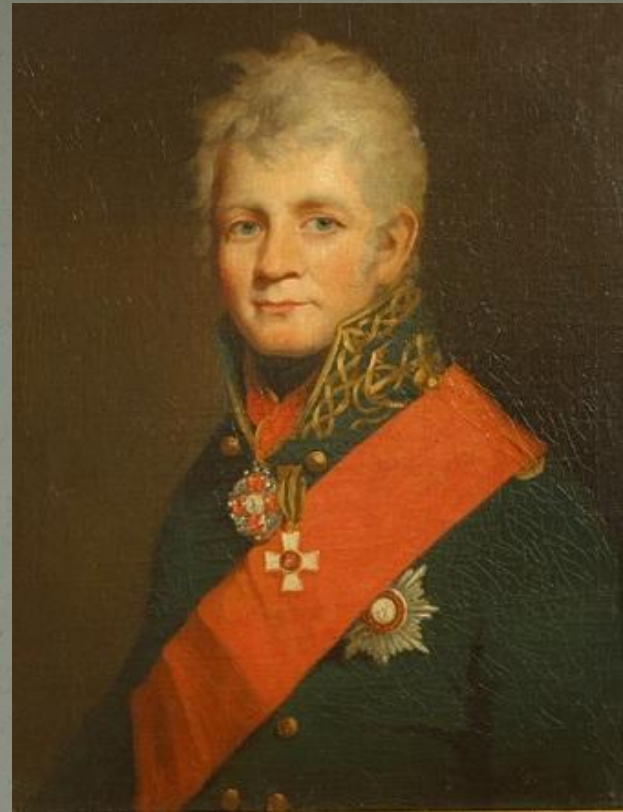
Адмирал Василий Чичагов