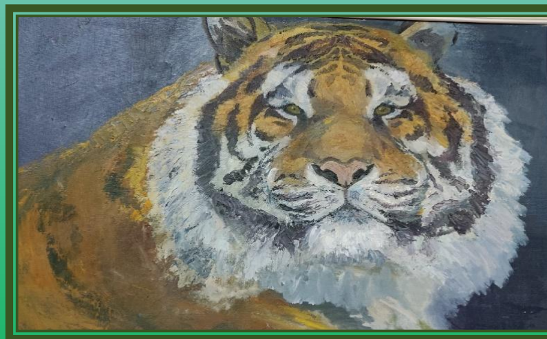
«Символ года» (Картон, масло)