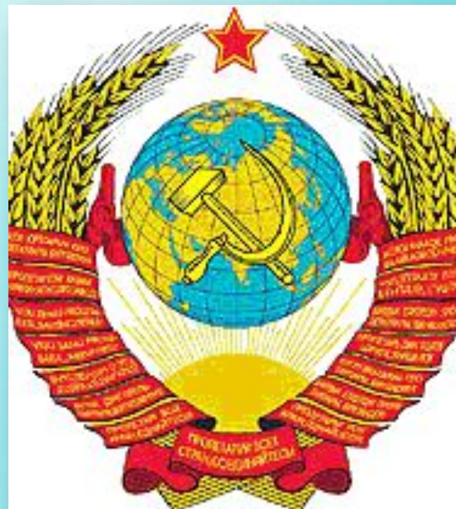
Герб СССР, принятый в 1923 году