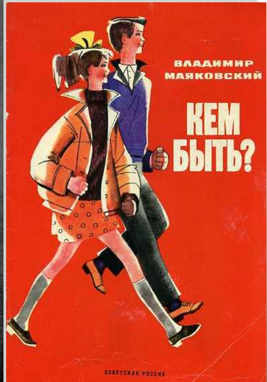
Владимир Владимирович Маяковский