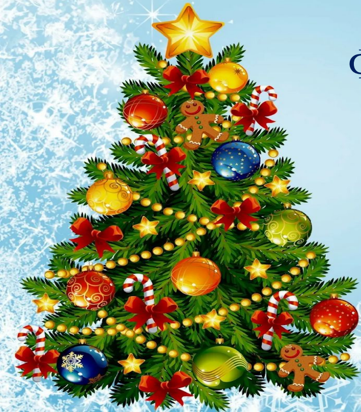
Фото выкладывайте в комментарии.