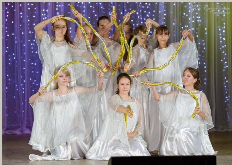
Молодежный театр «Призма»