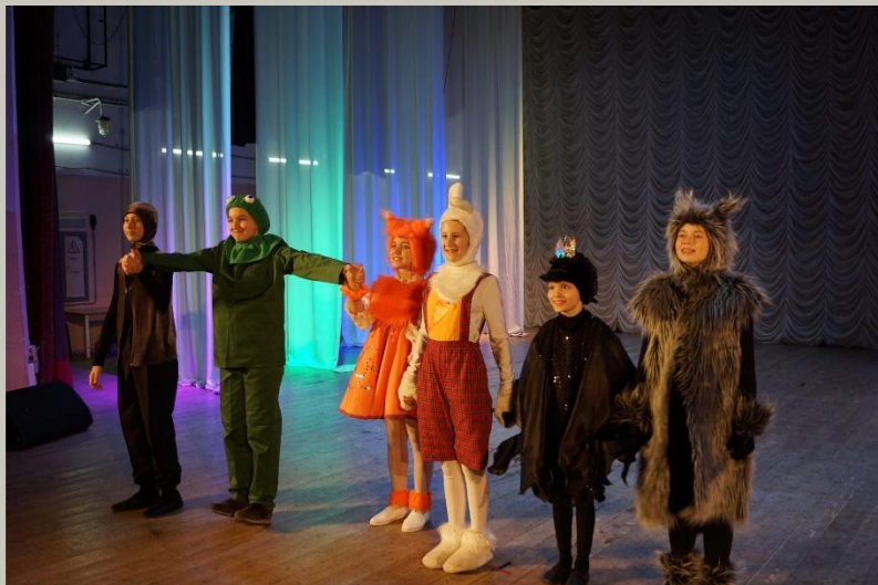
Театральная студия «Дом рыжей коровы»