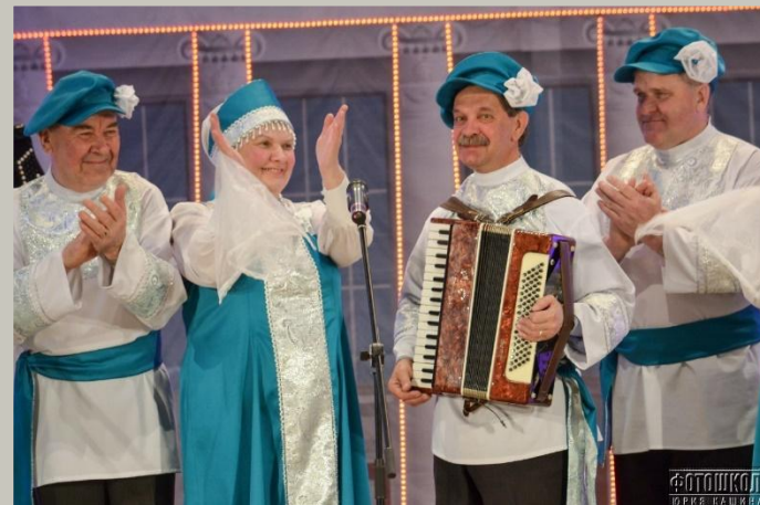
Народный коллектив Фольклорный ансамбль «Сударка»