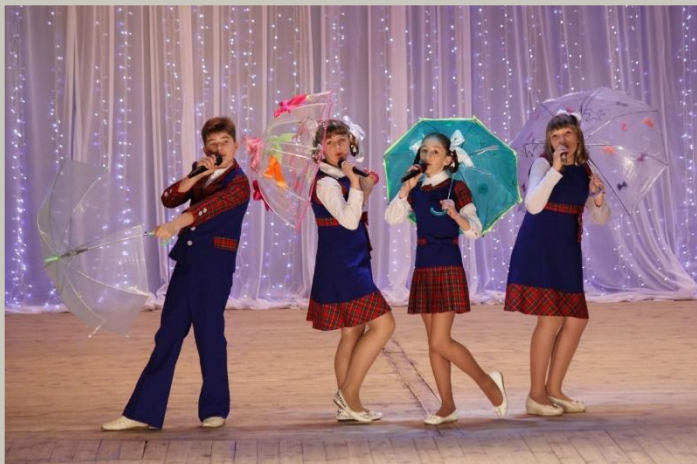
Образцовый коллектив «Студия народной песни «Дубль»