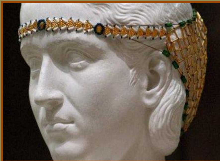
«Сфендона». Головное украшение знатной римлянки, III в. н.э.