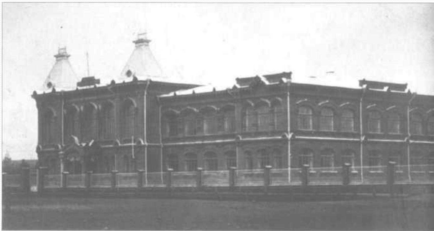
Майкоп. Реальное училище.