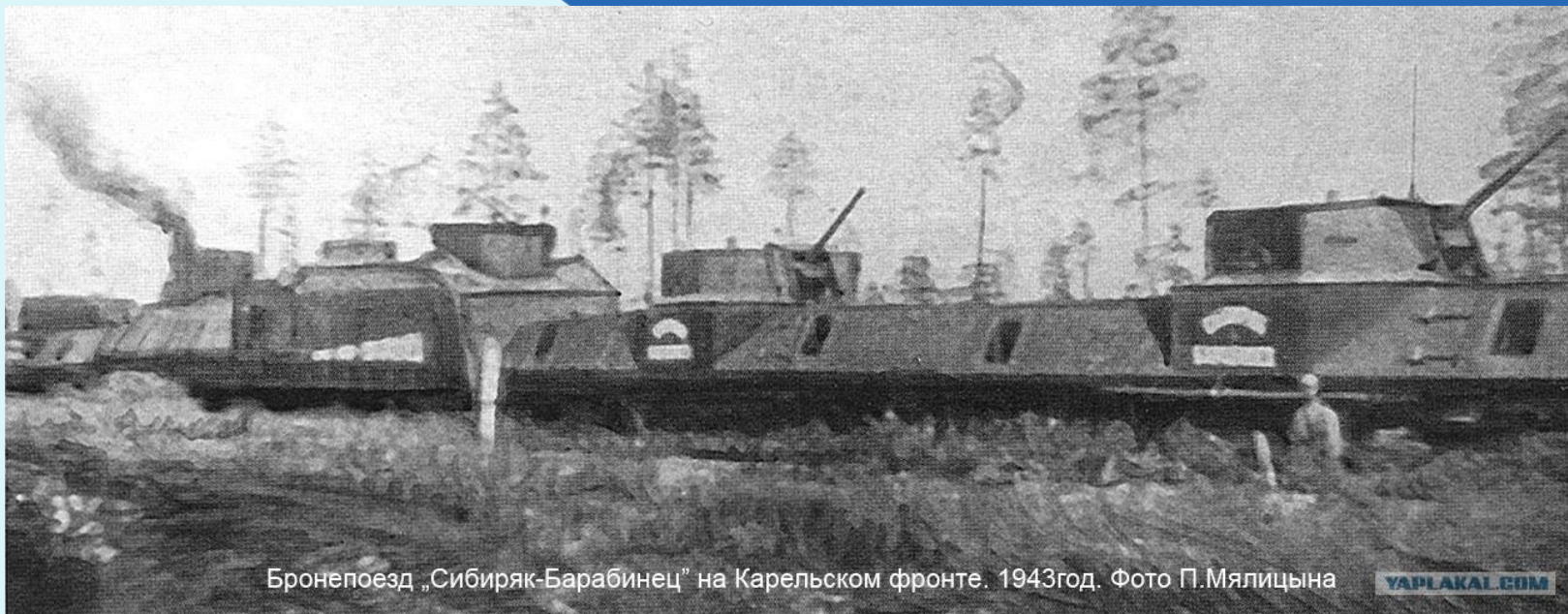
Бронепоезд „Сибиряк-Барабинец“ на Карельском фронте. 1943год.