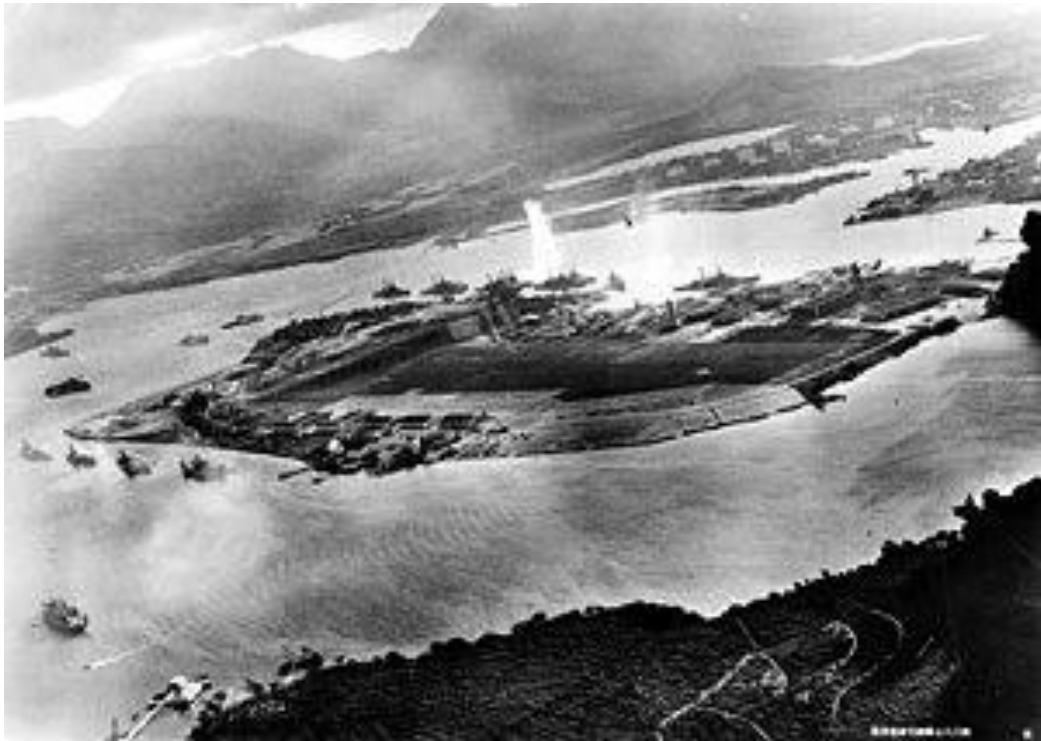
Нападение на Перл-Харбор

Утром 7 декабря 1941 г., после 10-дневного перехода, японские корабли приблизились к Пёрл-Харбору. С авианосцев поднялись в воздух более 350 самолетов.