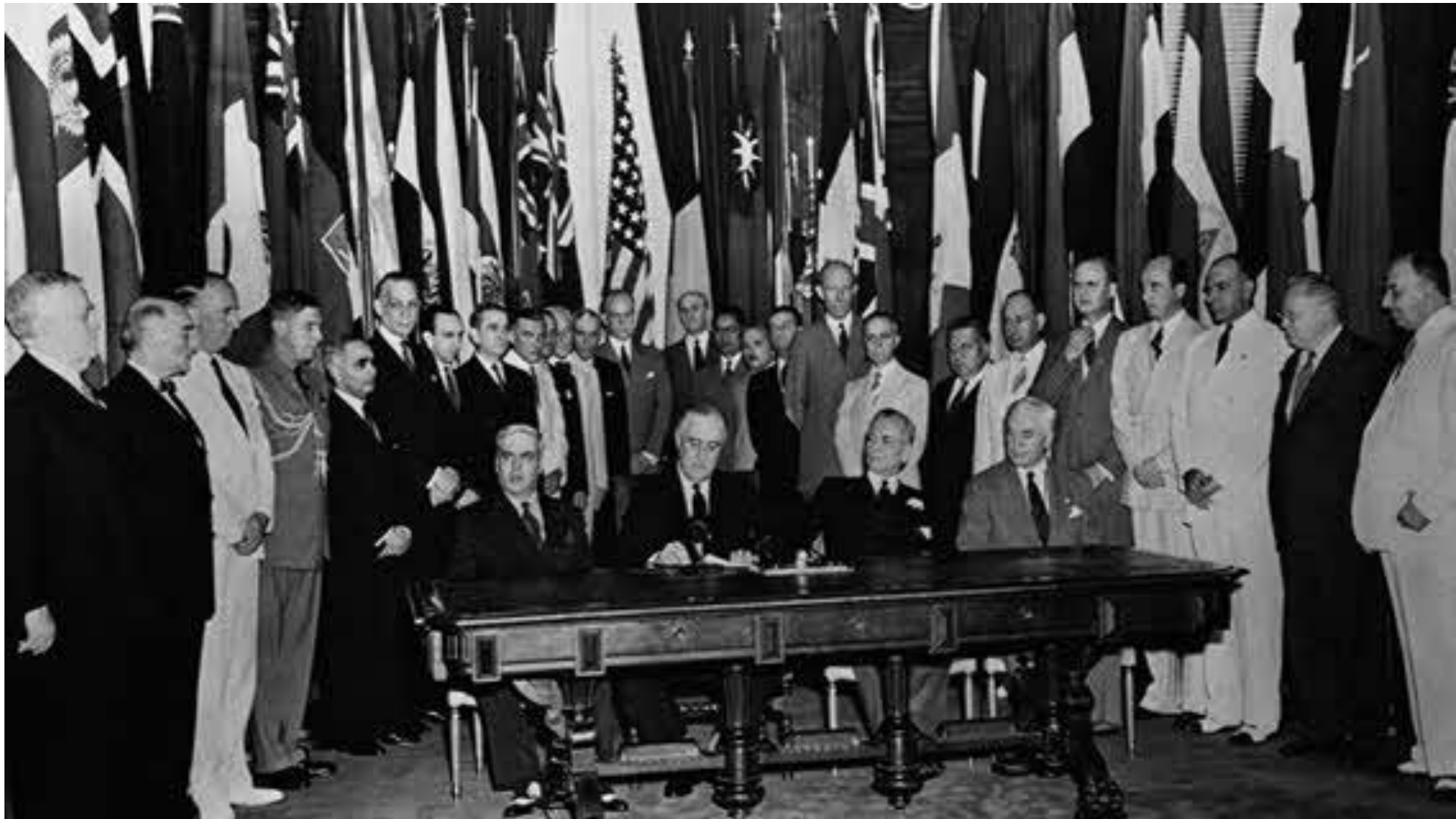
Подписание Декларации Объединённых Наций. Вашингтон. 1 января 1942 г.