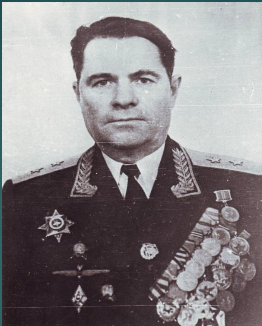
АВДОНИН ПАВЕЛ ИЗОСИМОВИЧ- ГЕНЕРАЛ-ЛЕЙТЕНАНТ АВИАЦИИ (1978г.) НАЧАЛЬНИК УПРАВЛЕНИЯ В АППАРАТЕ ГЛАВНОКОМАНДУЮЩЕГО ВВС . УЧАСТНИК ВЕЛИКОЙ ОТЕЧЕСТВЕННОЙ ВОЙНЫ. УРОЖЕНЕЦ с. ШАЛЫ АТЮРЬЕВСКОГО РАЙОНА.