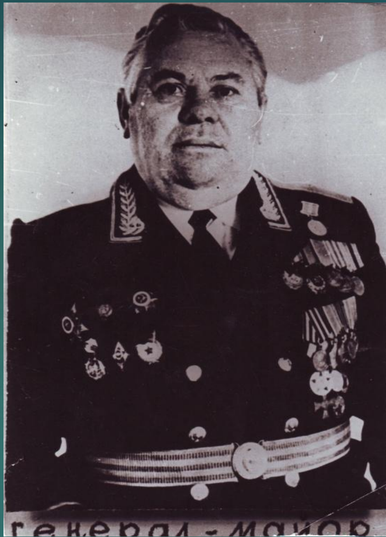
АБРАМОВ АЛЕКСАНДР АНДРЕЕВИЧ -ГЕНЕРАЛ-МАЙОР(1969Г.) ПЕРВЫЙ ЗАМЕСТИТЕЛЬ НАЧАЛЬНИКА УПРАВЛЕНИЯ МИНИСТЕРСТВА ОБОРОНЫ. УЧАСТНИК ВЕЛИКОЙ ОТЕЧЕСТВЕННОЙ ВОЙНЫ. УРОЖЕНЕЦ с. КАЛИНОВО ИЧАЛКОВСКОГО РАЙОНА.