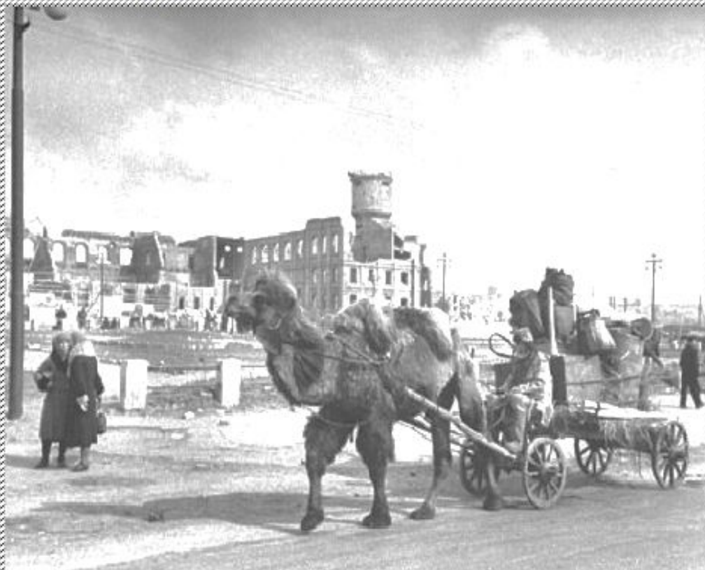
Запряженный в телегу верблюд на улице Сталинграда. На заднем плане — полуразрушенный вокзал «Сталинград-1».