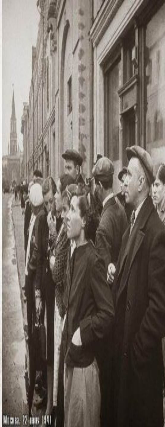
Москва. 22 июня 1941

На рассвете 22 июня 1941 года без объявления войны, вероломно нарушив договор о ненападении между Германией и СССР, немецко-фашистские войска внезапно вторглись на советскую территорию в соответствии с заранее подготовленными планами.