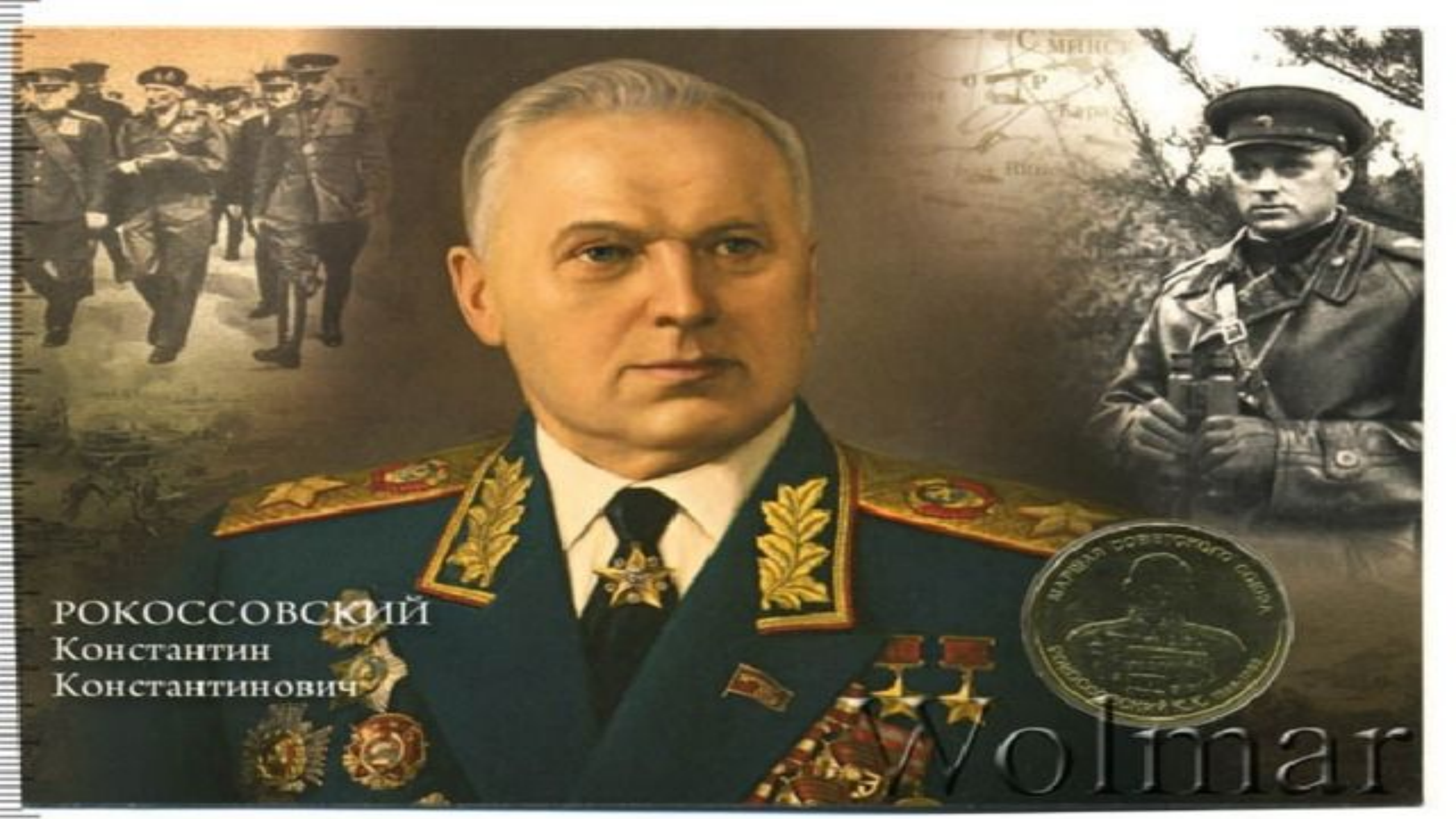
РОКОССОВСКИЙ Константин Константинович