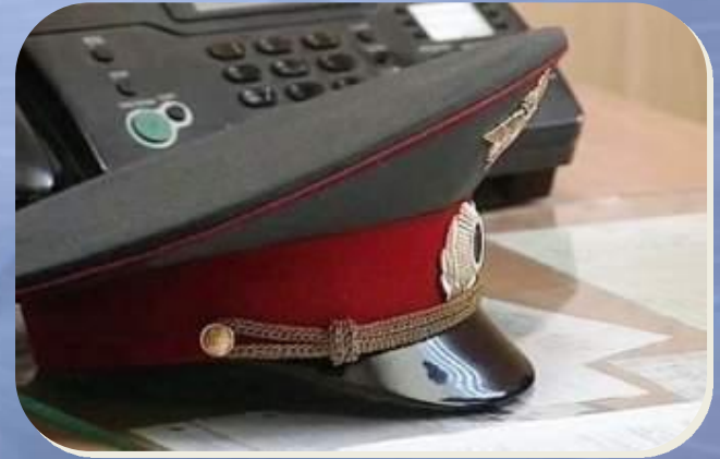
Обращение в правоохранитель- ные органы