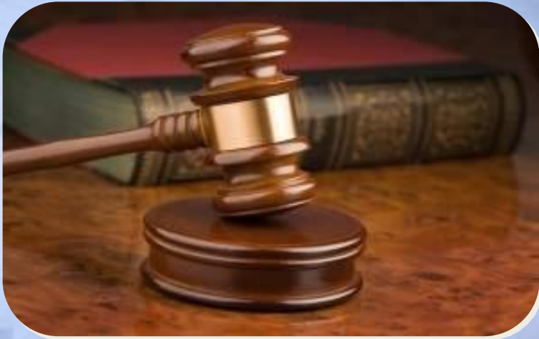
Обращение в суд