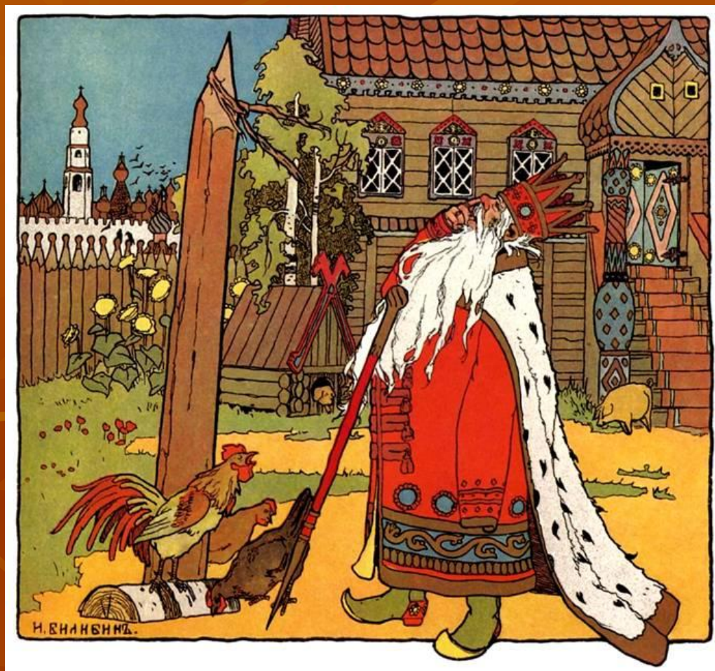
«Царевна - лягушка»