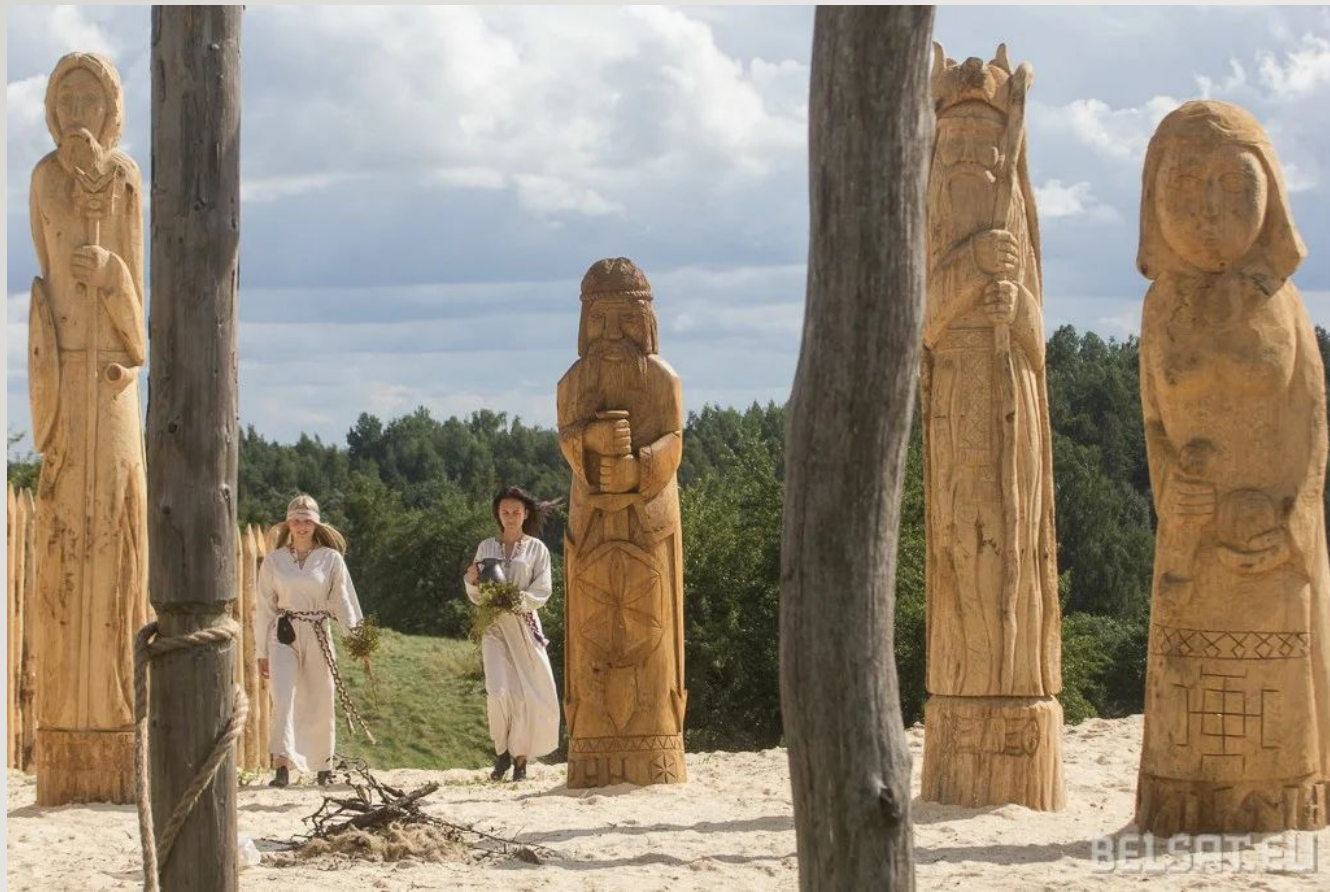
Славянский бог Солнца Дажьбог.