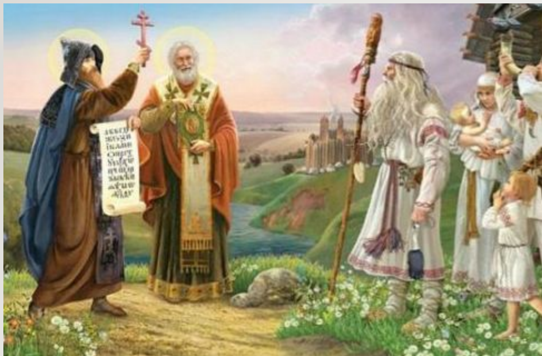
Преподобный Нестор Летописец