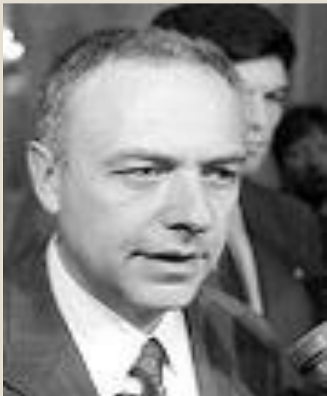
Андрей Владимирович Козырев — с октября 1990 по январь 1996