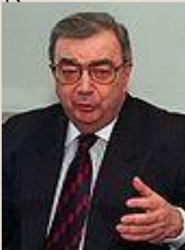
Евгений Максимович Примаков — с января 1996 по сентябрь 1998