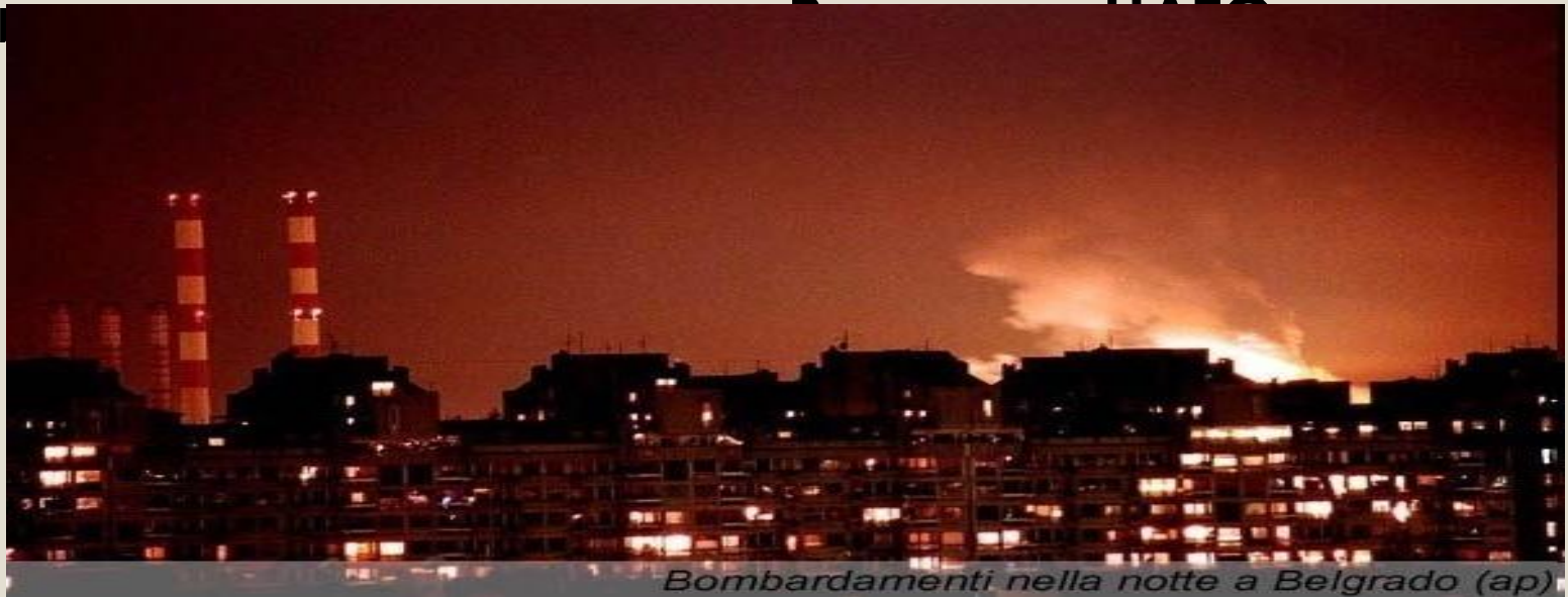
Bombardamenti nella notte a Belgrado