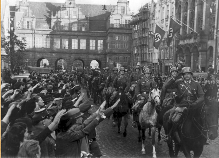
Вступление германских войск в Данциг, сентябрь 1939г.

Война началась 1 сентября 1939 года в 4 ч. 30 мин. с массированного налёта германских самолётов на польские аэродромы и последовавшего в 4 ч. 45 мин. фронтального наступления.