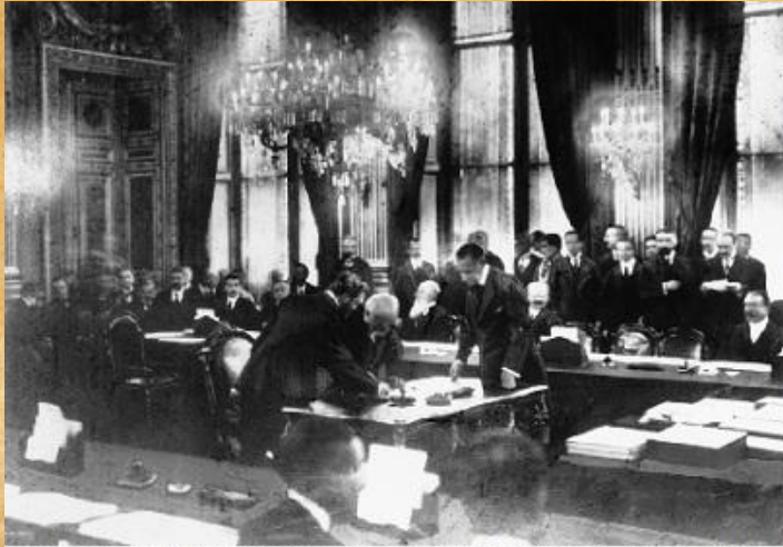
подписание Версальского мирного договора, 1919 г.

«Глубинные причины Второй мировой войны во многом вытекают из решений, принятых по итогам Первой мировой. Версальский договор стал для Германии символом глубокой несправедливости. Фактически речь шла об ограблении страны, которая обязана была выплатить западным союзникам огромные репарации, истощавшие ее экономику»