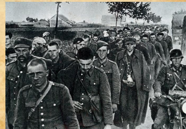
Польские военнопленные, сентябрь 1939г.