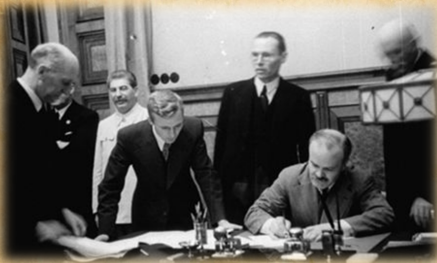
Подписание В. Молотовым Пакта о ненападении между СССР и Германией, 23 августа 1939 года

Ответственность за развязывание Второй мировой войны, кроме Гитлера, лежит на Сталине и советском руководстве, так как война началась через неделю после подписания пакта Молотова – Риббентропа.