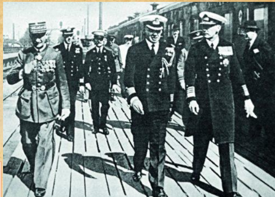
Английская и французская военные миссии в Ленинграде перед отправлением в Москву на переговоры, август 1939г.

Лето 1939 года стало временем интенсивных дипломатических переговоров между великими державами Европы. Каждый хотел получить максимум выгод и обезопасить себя от надвигающихся военных потрясений. В июле-августе 1939 г. Великобритания вела секретные переговоры с Германией о разделе мира на сферы влияния, а также подписала договор с Японией, признав её интересы в Китае.