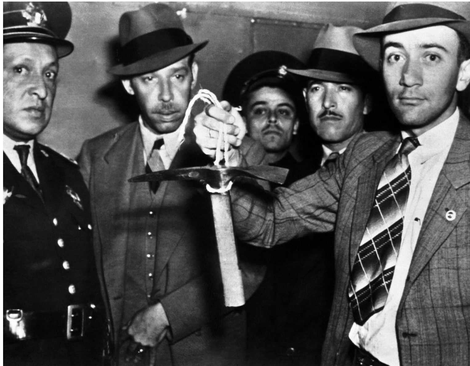
Ледоруб которым убили Троцкого

Меркадер рассчитывал убить Троцкого и скрыться до того, как поднимется паника, но одного удара ледорубом оказалось мало. Раненный в голову Троцкий схватил убийцу, а дальше в дело вмешалась его охрана. Позднее Меркадер признался, что не был готов к такому повороту событий. Человек, с ледорубом в затылке, сумел оказать сопротивление и прожить с тяжелейшей раной более суток. В момент смерти Троцкого, избитый до полусмерти Меркадер, находился в мексиканской тюрьме, где провел следующие 20 лет.