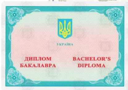
Диплом бакалавра з єврододатком