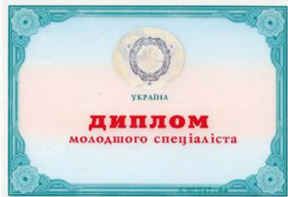
Диплом молодшого спеціаліста