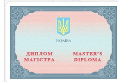
Диплом магістра з єврододатком