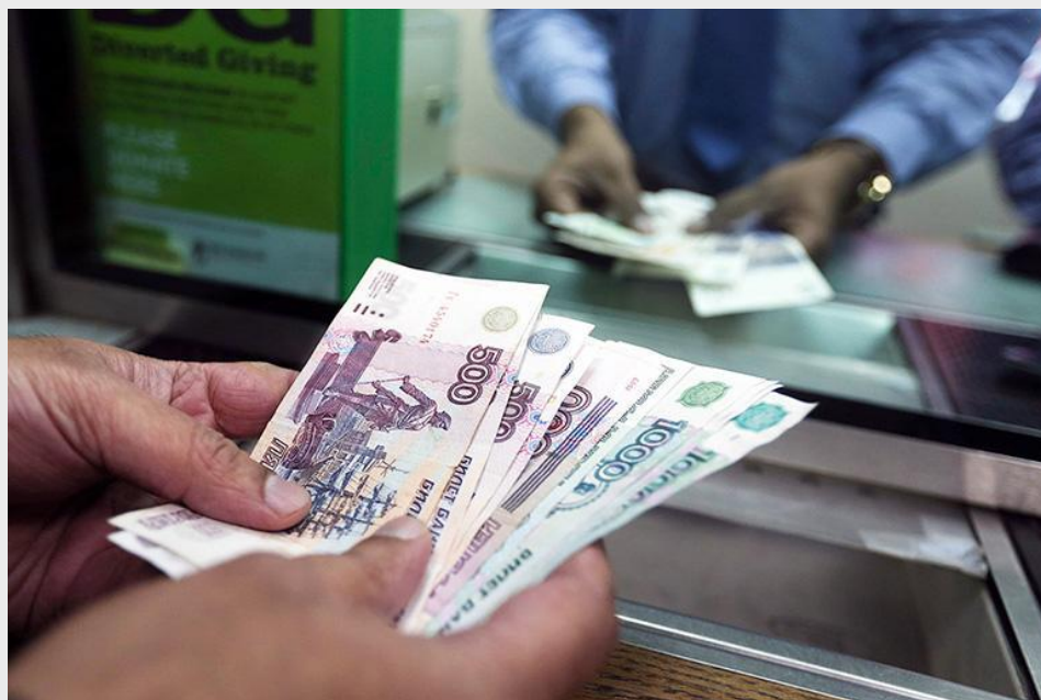
Вклад в банк предполагает получение прибыли.

При этом часть денег может быть застрахована от банкротства финансовой организации. В России таким институтом является Агентство по страхованию вкладов , которое гарантирует возврат 1,4 млн руб., что бы ни произошло с банком.