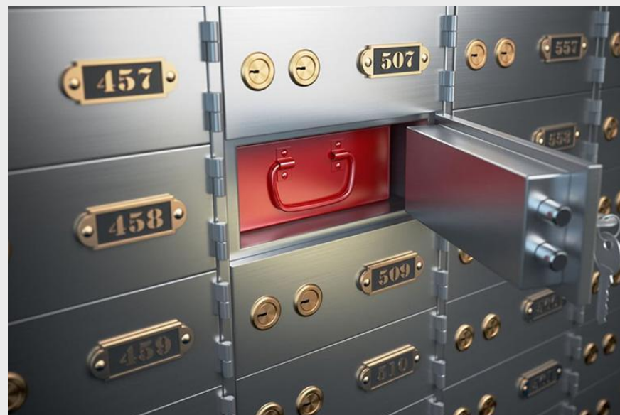
Наличная форма подразумевает хранение ресурсов в ячейках банков.

Такие подразумевают хранение ресурсов в бумажном виде дома или в сейфовых ячейках банков. Главной чертой сбережений является сохранение номинальной стоимости богатства, уменьшенное на размер инфляции.