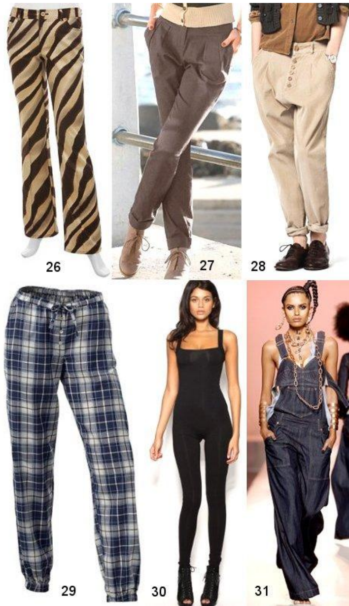
фото выше: 29 - пижамные брюки, 30 - облегающий комбинезон для гимнастики, 31 - комбинезон с лямками.

фото: 26 - брюки-сафари, 27 - брюки-бананы, 28 - брюки Бэгги (брюки бой-френда).