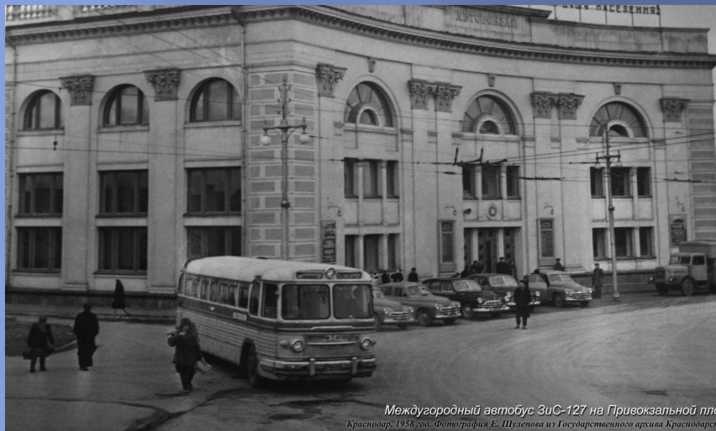
Междугородный автобус ЗиС-127 на Привокзальной площади Краснодар, 1958 год.