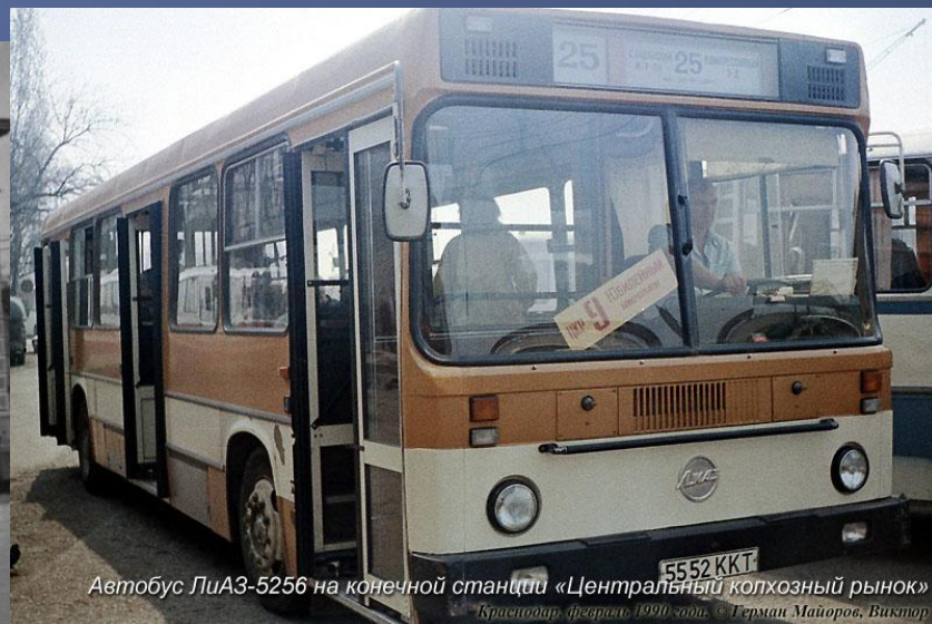
Автобус ЛиАЗ-5256 на конечной станции «Центральный колхозный рынок» Краснодар, Арзвирит, 1990 год. © Герман Майоров, Виктор