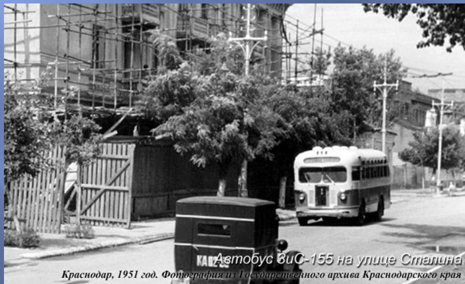
Автобус ЗиС-155 на улице Сталина Краснодар, 1951 год.