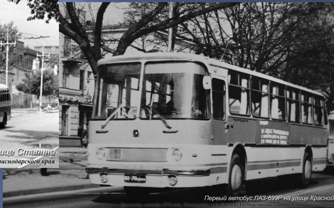
Первый автобус ЛАЗ-699Р на улице Красной Краснодар, октябрь 1976 года.