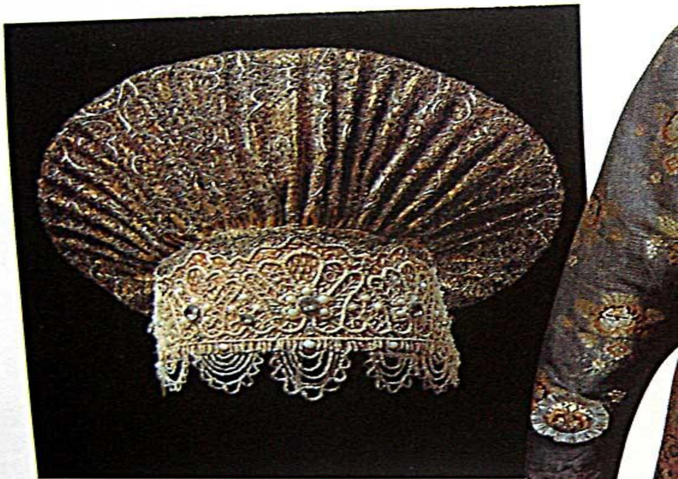
Праздничный женский головной убор — кокошник типа «сборник». Архангельская губерния. Начало XIX в. Исторический музей. Москва.