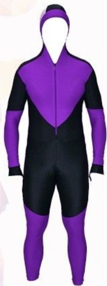
КОМБИНЕЗОН ДЛЯ ТРЕНИРОВОК