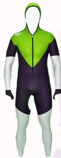
КОМБИНЕЗОН ДЛЯ СОРЕВНОВАНИЙ