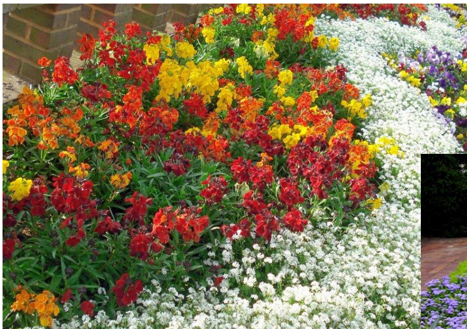
Цветочные композиции летников

Главное преимущество летников перед другими цветочными растениями - цветение все или почти все лето. Цветение наступает через 6...7 или 8...10 недель после посева.