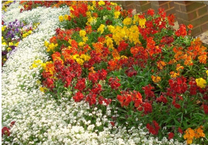
Цветочные композиции летников

Ассортимент летников настолько богат, что из него всегда можно выбрать необходимые растения для конкретной цветочной композиции растения по форме и цвету.