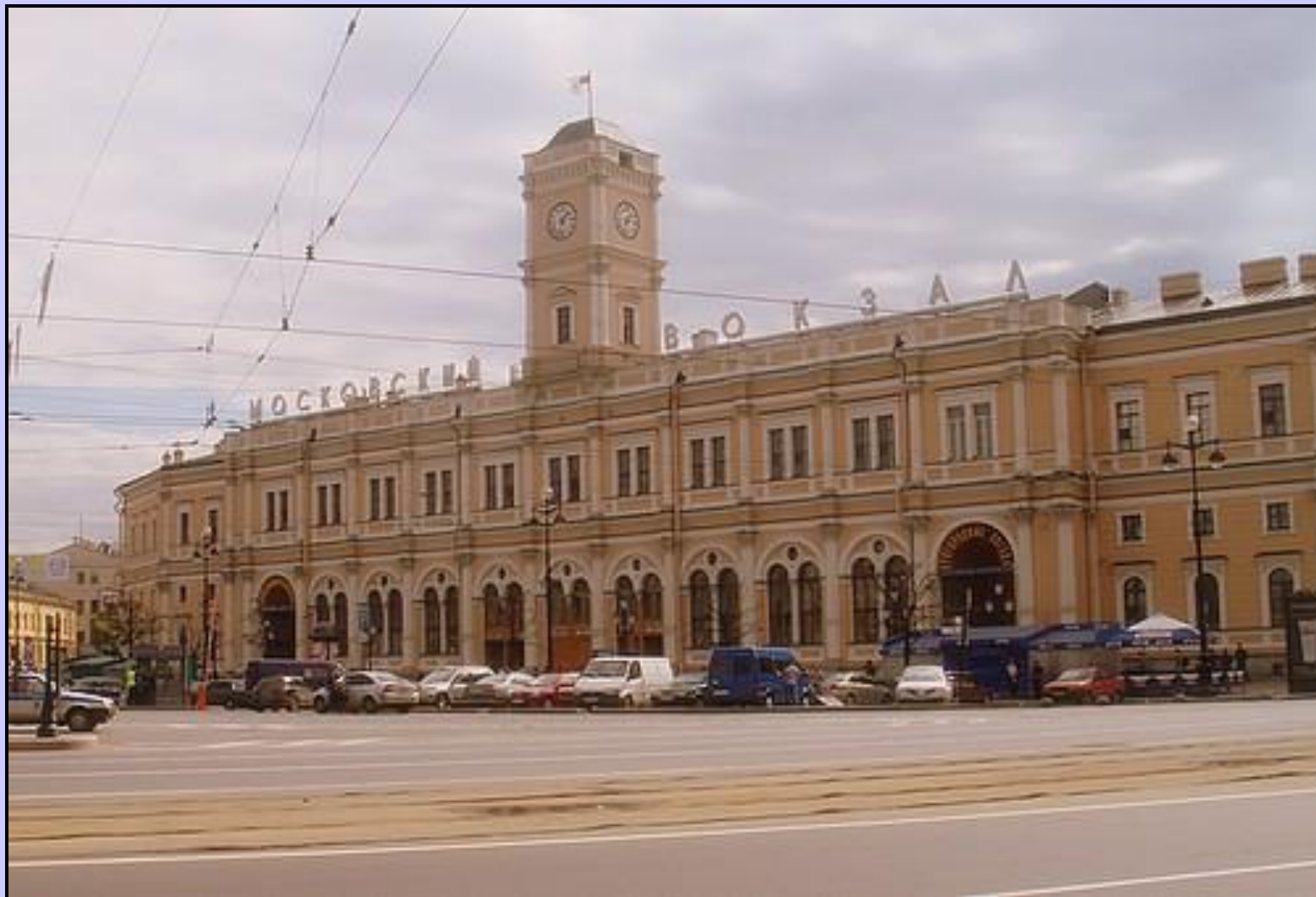
Московский Железнодорожный вокзал