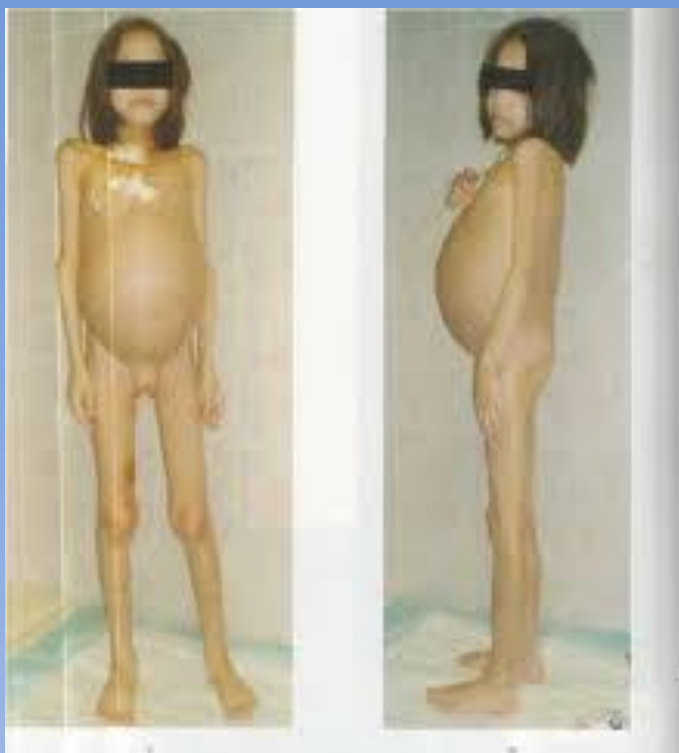
Рис. 3. Внешний вид ребенка при поступлении.