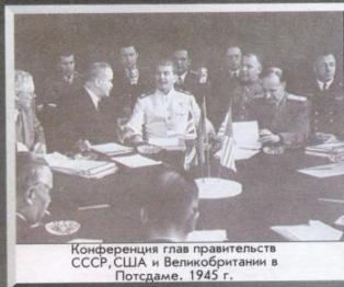
Конференция глав правительств СССР, США и Великобритании в Потсдаме. 1945 г.