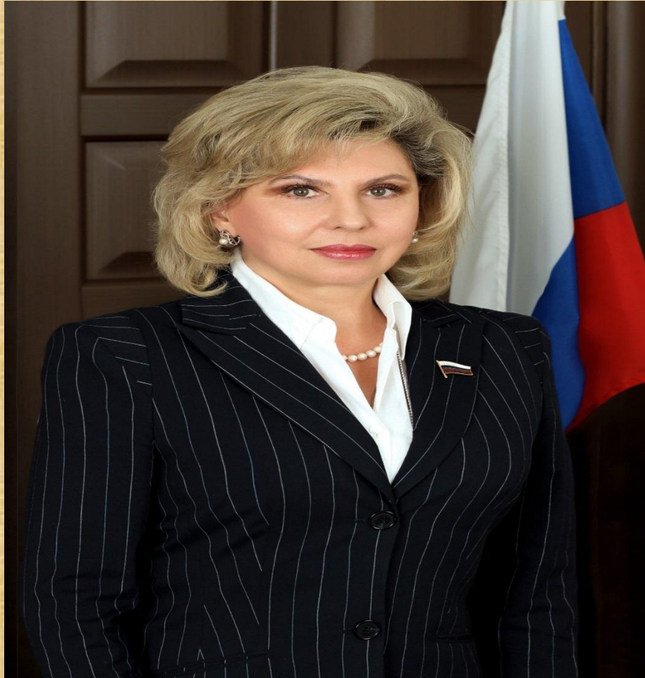
Москалькова Татьяна Николаевна