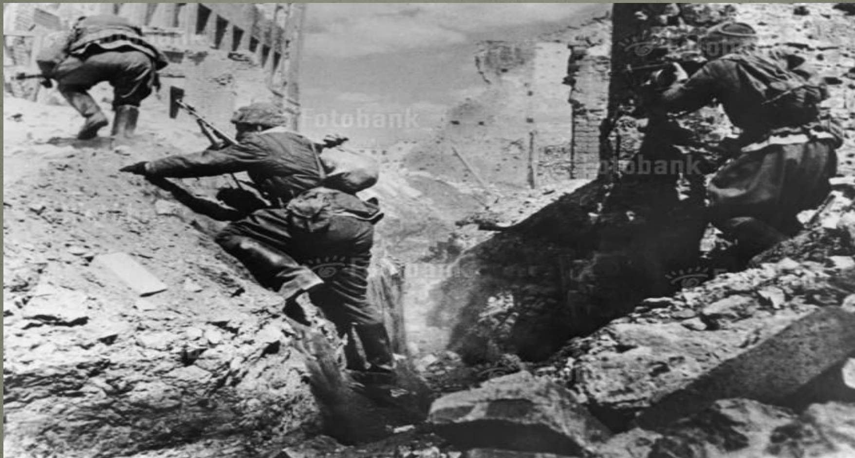
WWW.FOTOBANK.RU LD00-1 027 Archive Photos EO Сталинградская битва. Советские солдаты в атаке, около 1943.