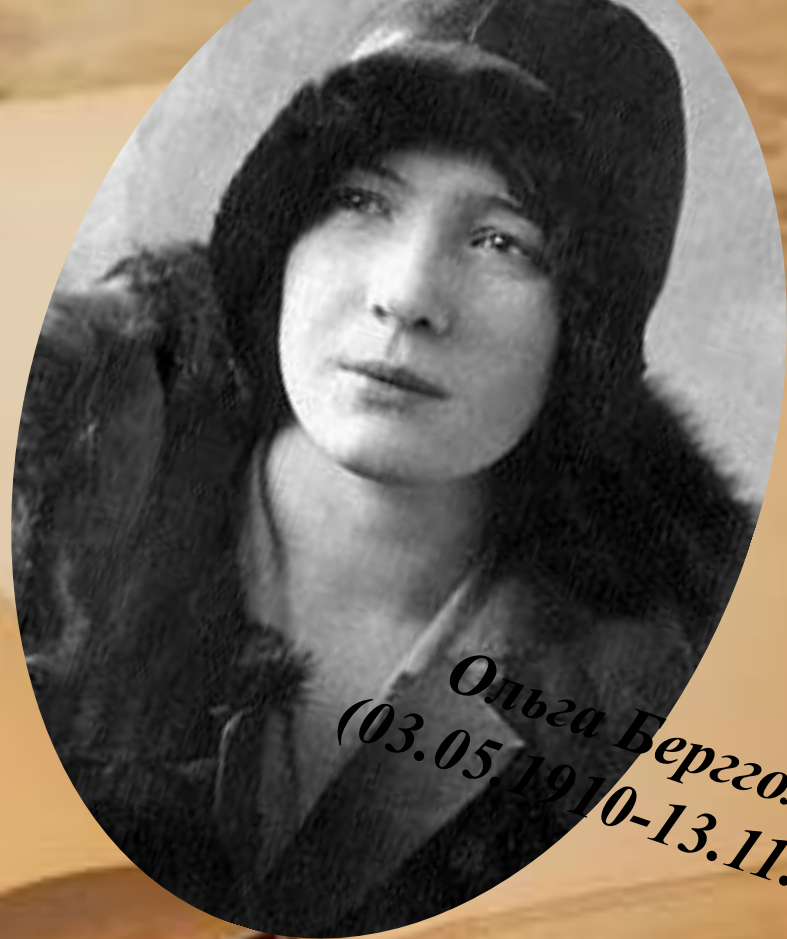
Ольга Берггольц (03.05.1910-13.11.1975)

Над Ленинградом — смертная угроза... Бессонны ночи, тяжёлый день любой. Но мы забыли, что такое слезы, что называлось страхом и мольбой.