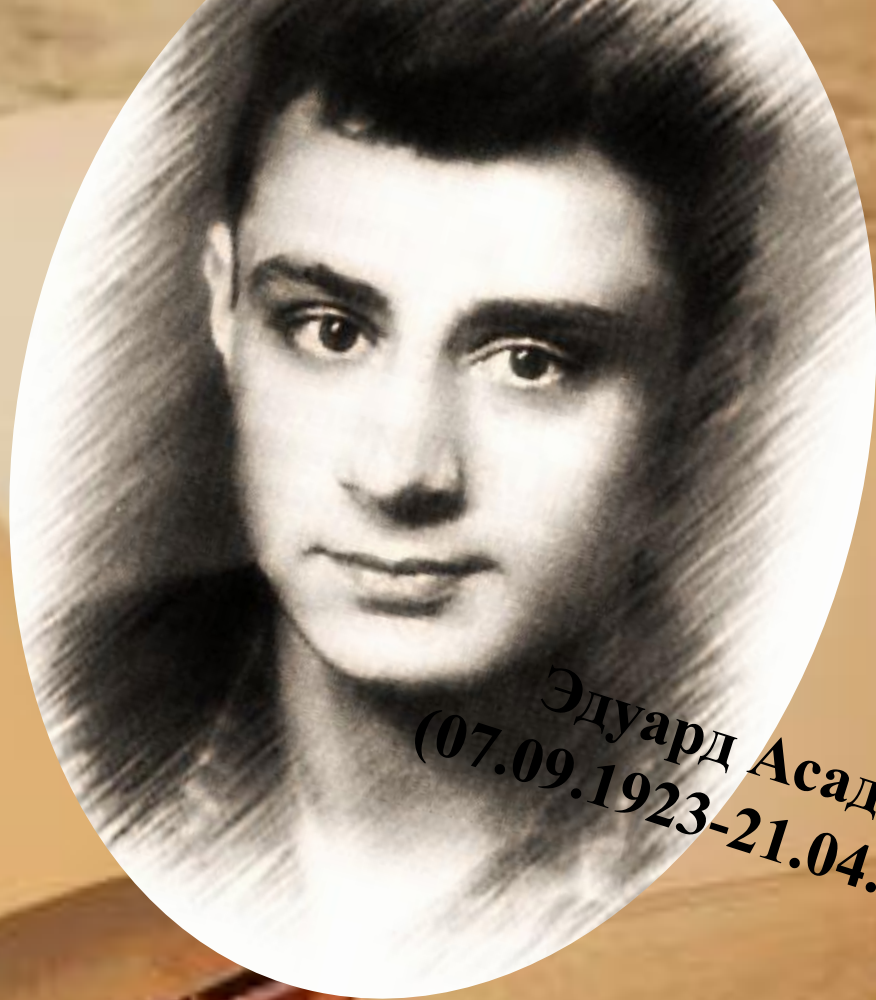
Эдуард Асадов (07.09.1923-21.04.2004)

Меж стиснутых пальцев желтела солома, Поодаль валялся пустой автомат, Лежал на задворках отцовского дома Осколком гранаты убитый солдат.