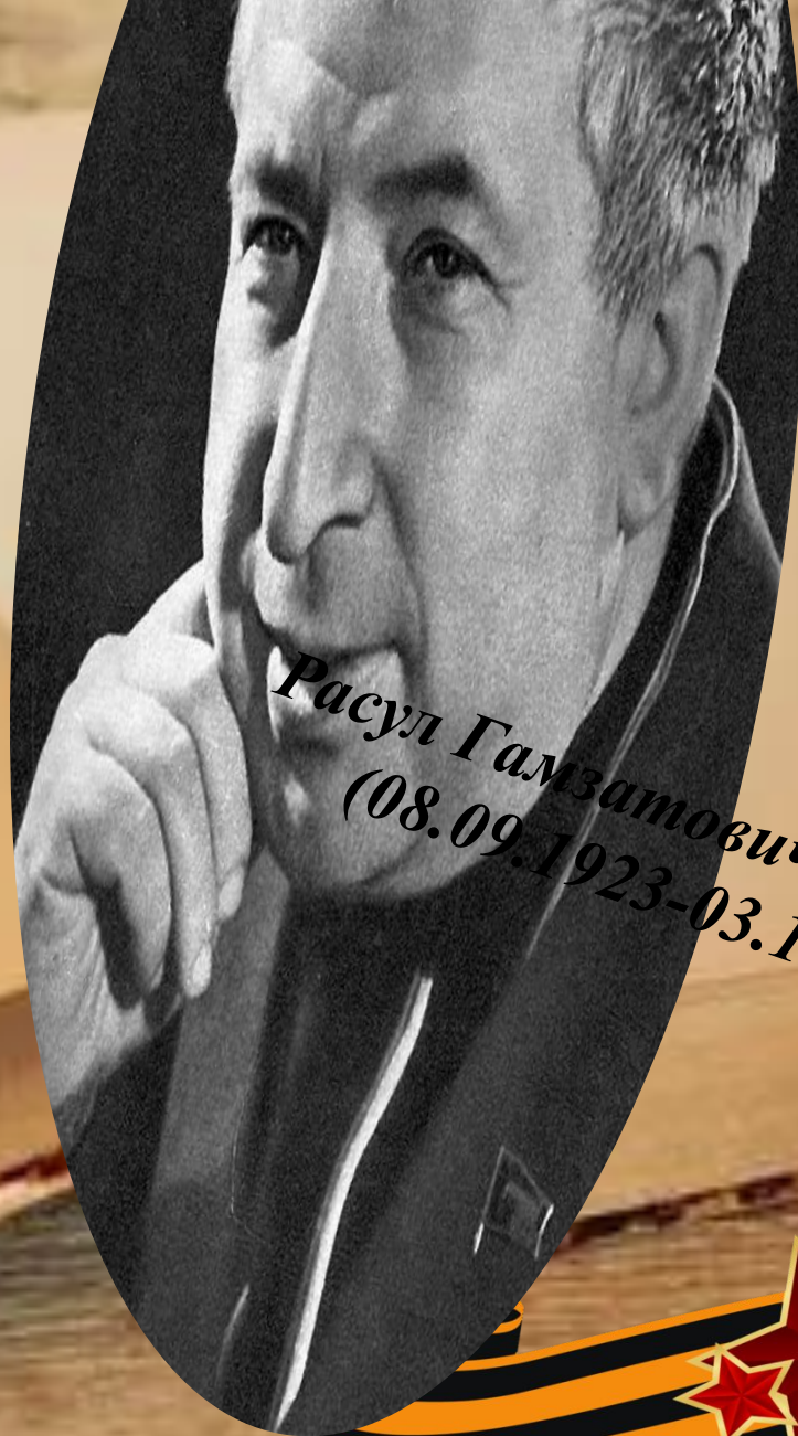
Расул Гамзатович Гамзатов (08.09.1923-03.11.2003)

Говорят, что посмертно Тела наши станут землею. Я поверить готов В немудреную эту молву. Пусть я стану частицей Земли, отвоеванной с бою, Той земли, на которой Сейчас я всем сердцем живу.