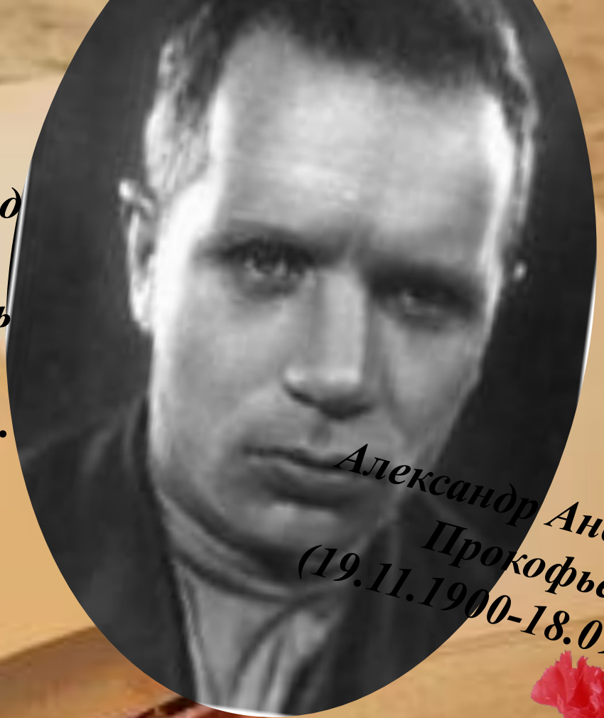
Александр Андреевич Прокофьев (19.11.1900-18.09.1971)

Товарищ, ты видел над нею Закаты в дыму и крови, Чтоб ненависть была сильнее, Давай говорить о любви. Под грохот тяжелых орудий Немало отхлынуло дней, Товарищ, мы - русские люди, Так скажем, что знаем о ней.