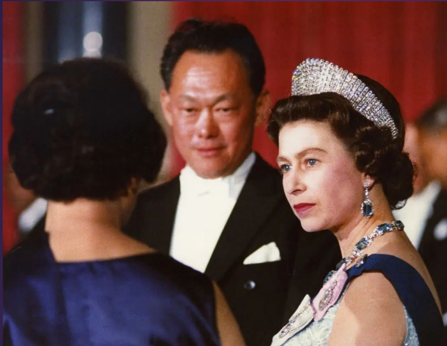
Королева Елизавета II с Ли Куан Ю в Букингемском дворце