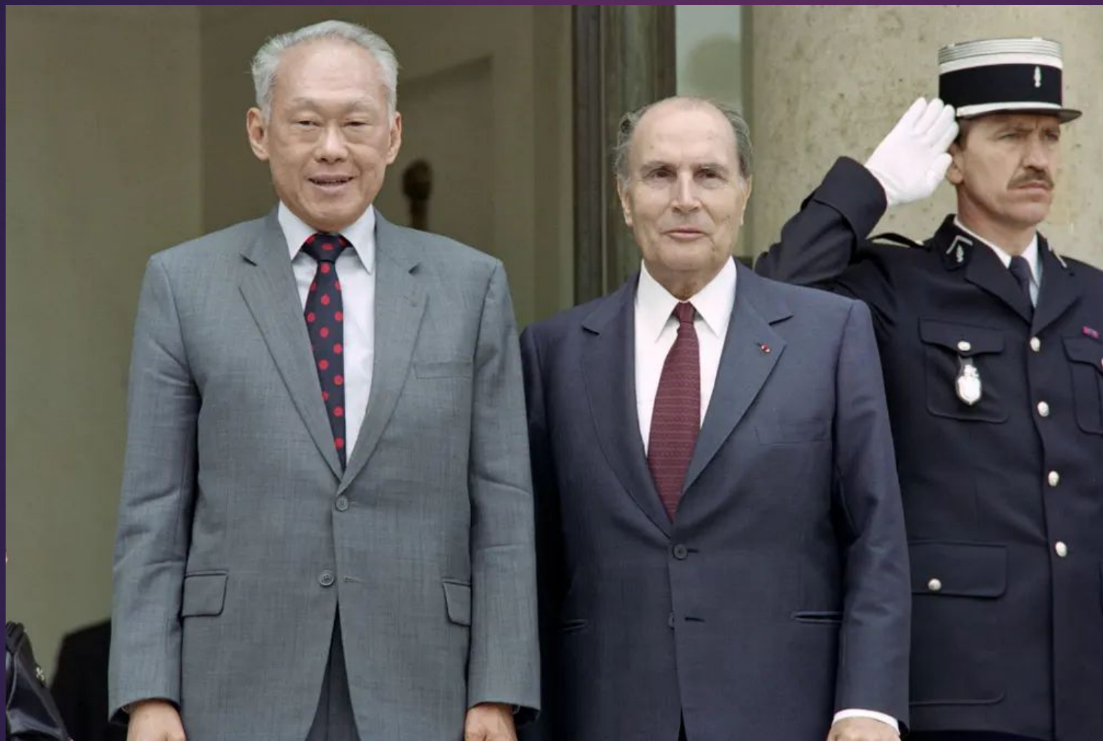
Ли и президент Франции Франсуа Миттеран позируют перед встречей в Елисейском дворце в Париже