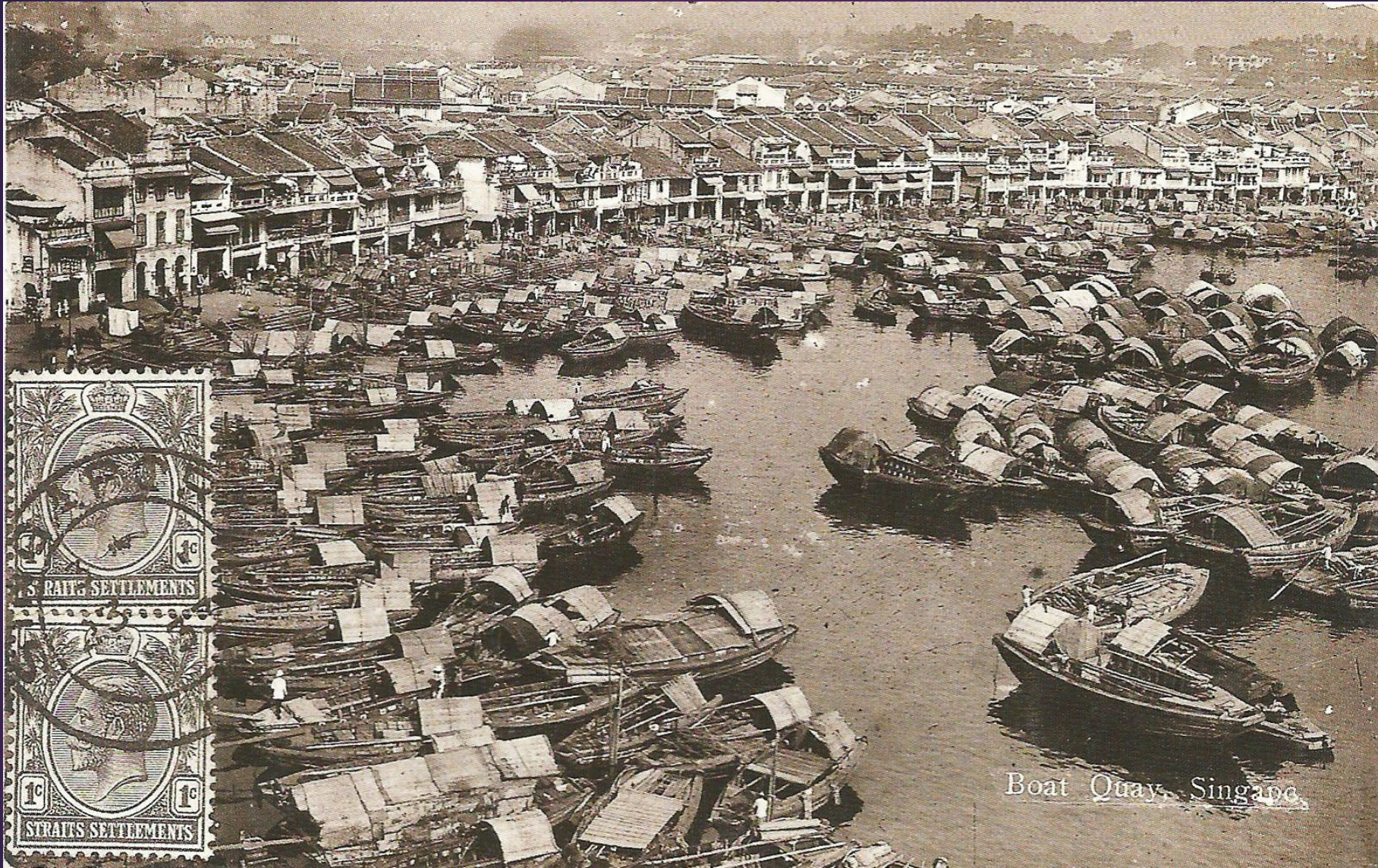
Boat Quay, Singapore