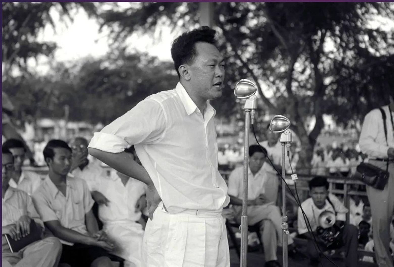
Ли Куан Ю выступает на митинге в парке Фаррер в Сингапуре