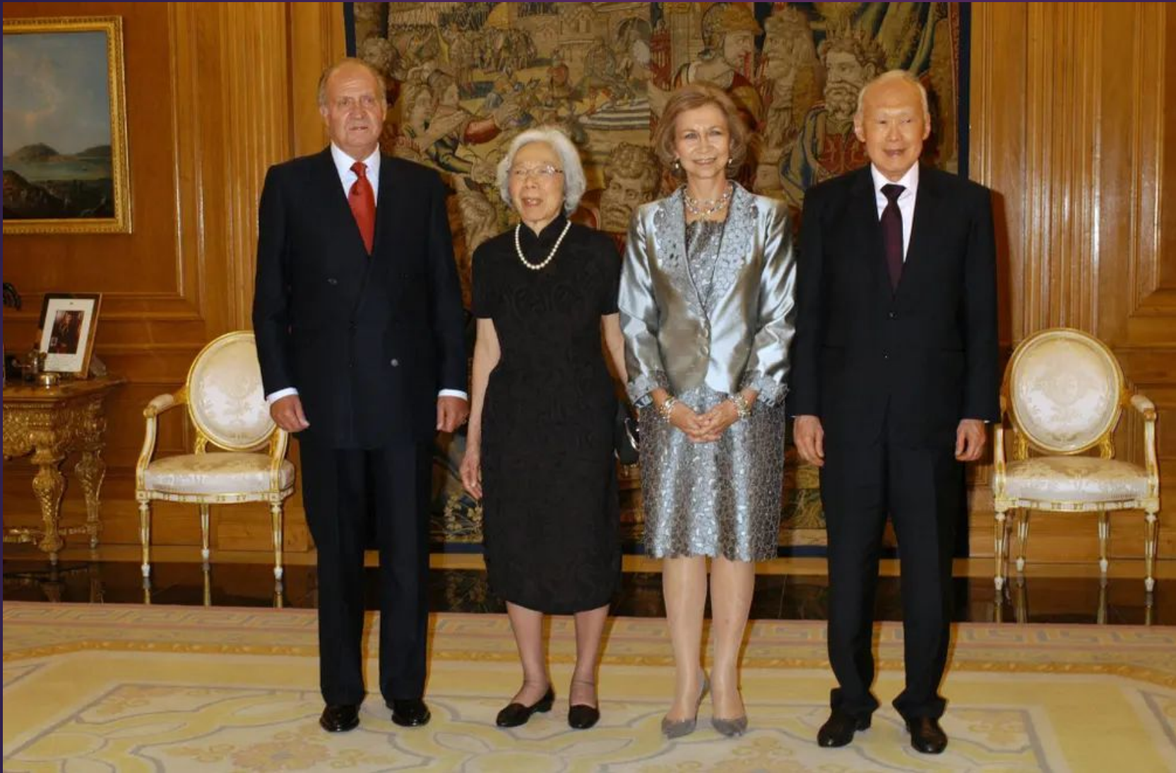
Король Хуан Карлос, Ква Геок Чу, королева София и Ли Куан Ю