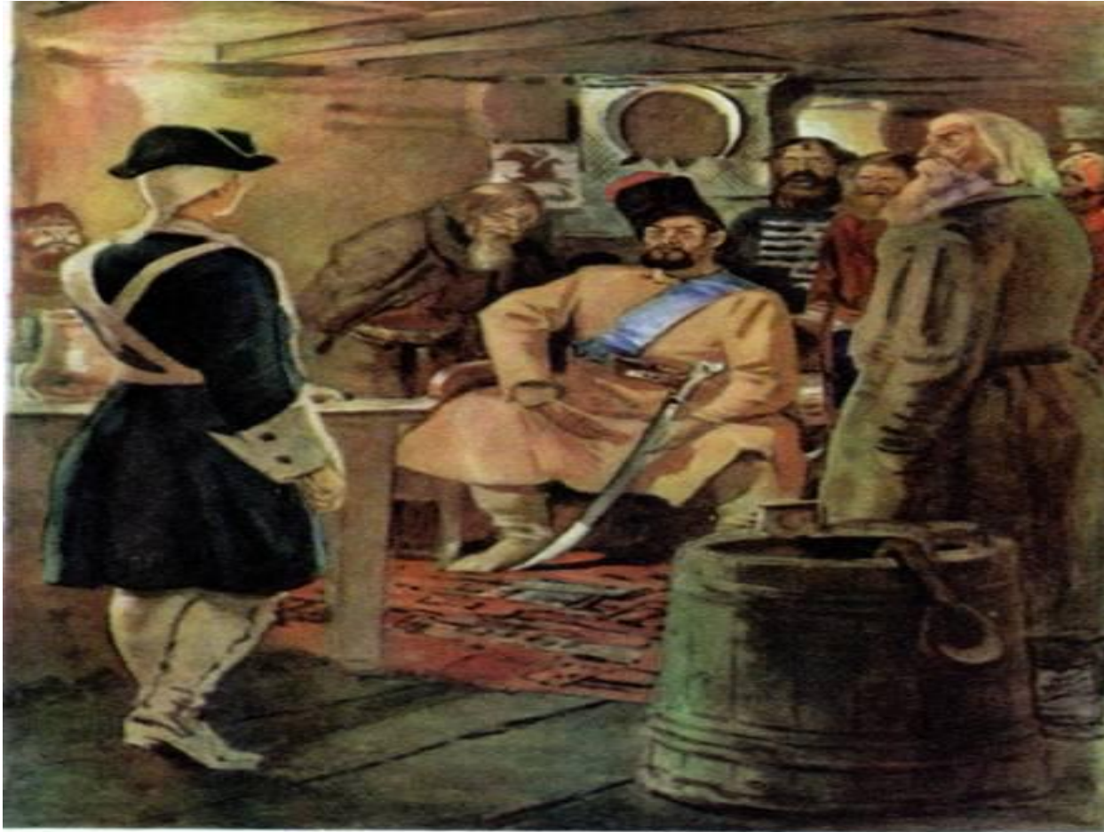
10. Сцена свидания Гринева с Пугачевым Художник С. В. Герасимов