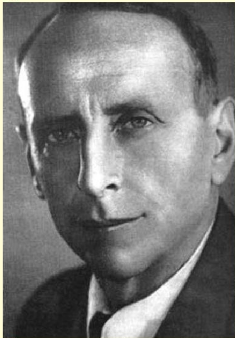
Евгений Львович Шварц