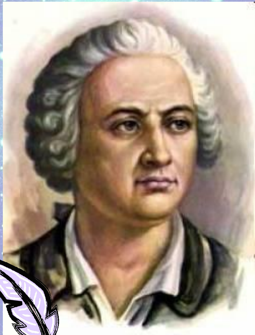
МИХАИЛ ВАСИЛЬЕВИЧ ЛОМОНОСОВ (1711 – 1765)