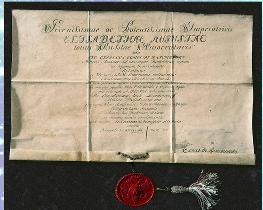
Диплом профессора химии