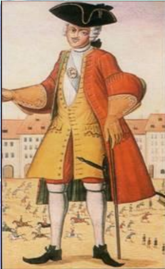
Студент немецкого университета