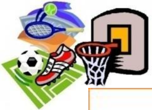
Результат анкетирования учащихся 5-7 классов (%)