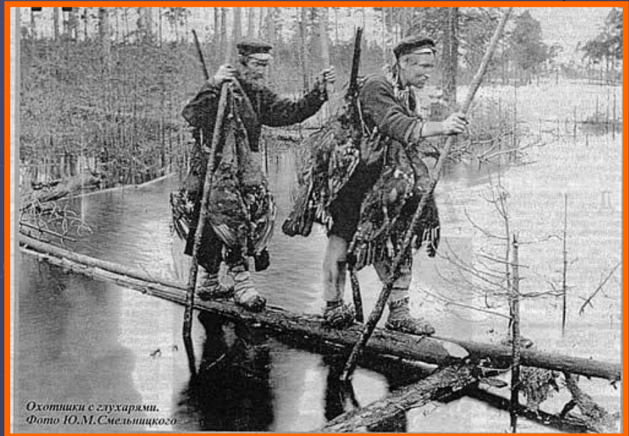
Охотники с глухарями.