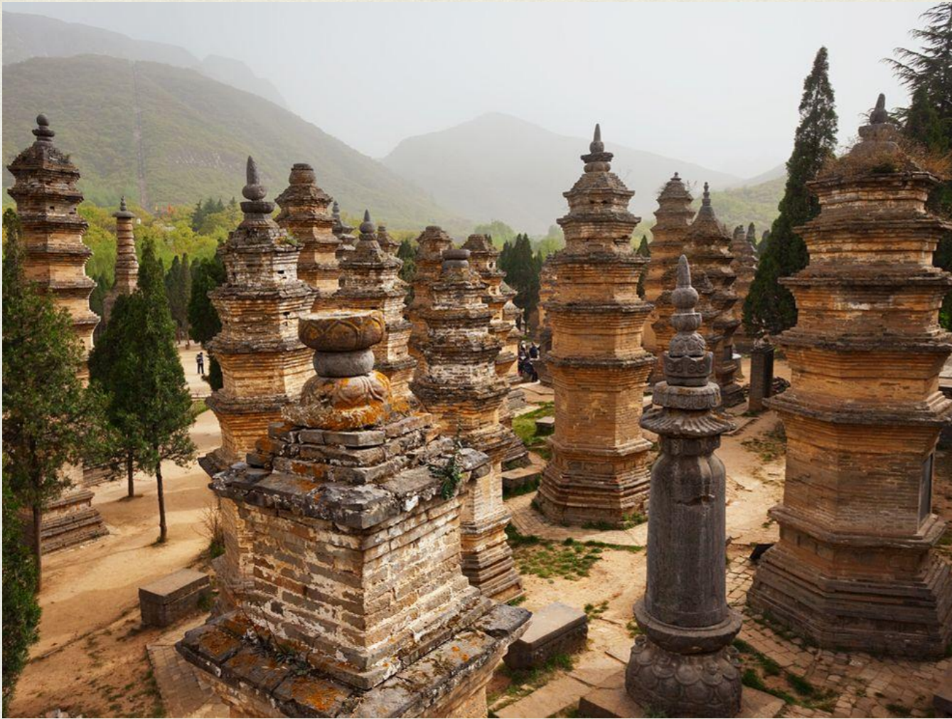
ЛОЯН(КИТ. ТРАД. 洛陽, УПР. 洛陽)