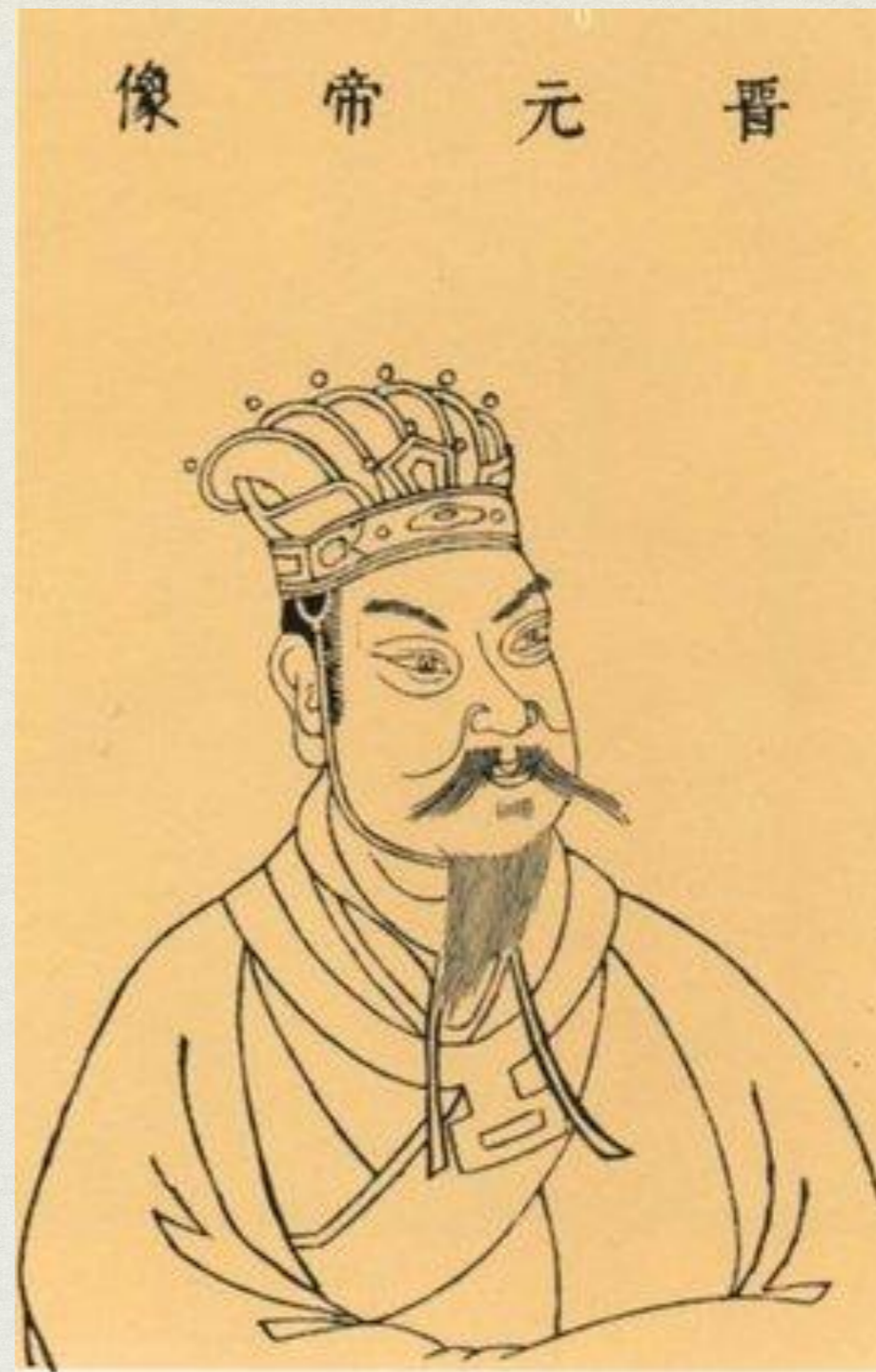
ЦЗИНЬСКИЙ ЮАНЬ-ДИ (晉 元帝) СЫМА ЖУЙ (司馬睿)