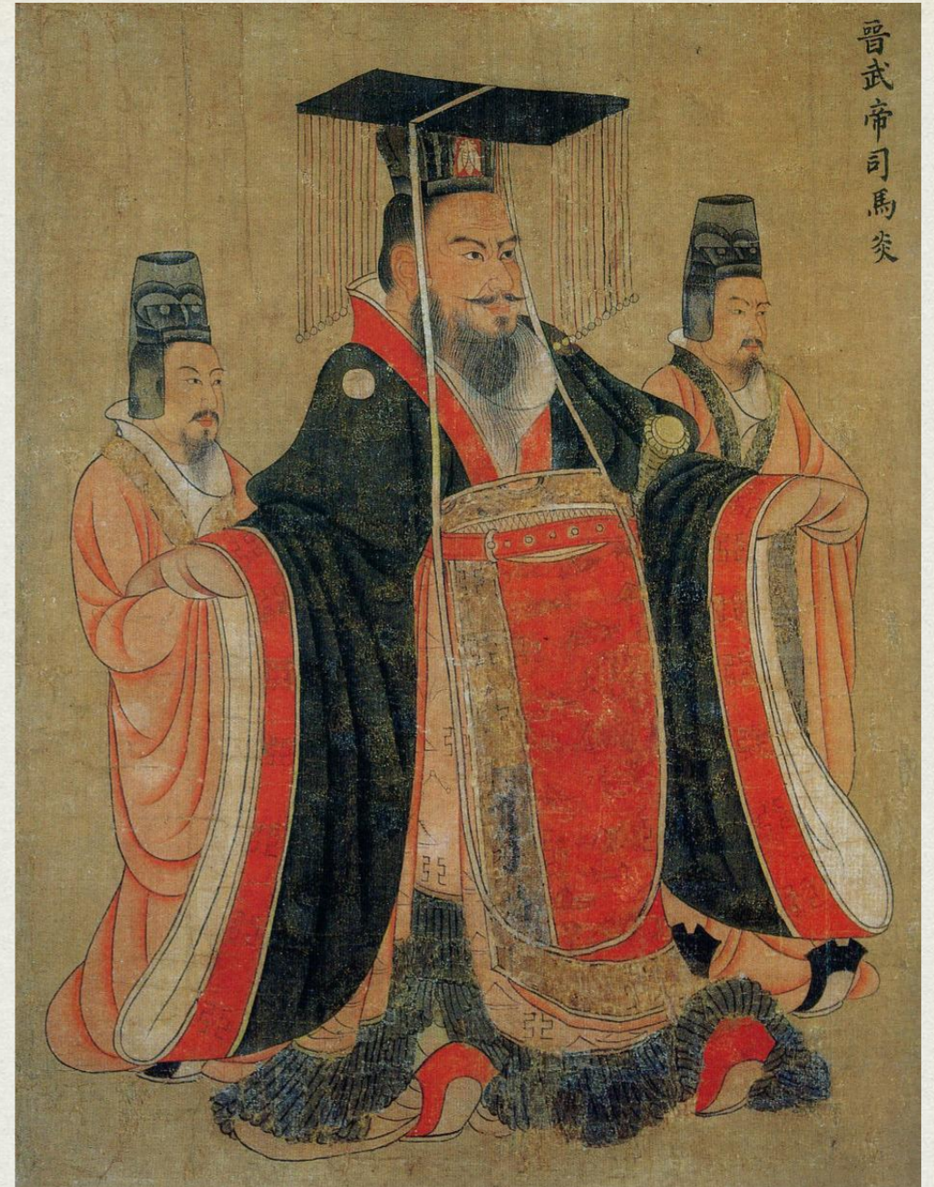
СЫМА ЯНЬ (司馬炎) ЦЗИНЬСКИЙ У-ДИ (晉武帝)