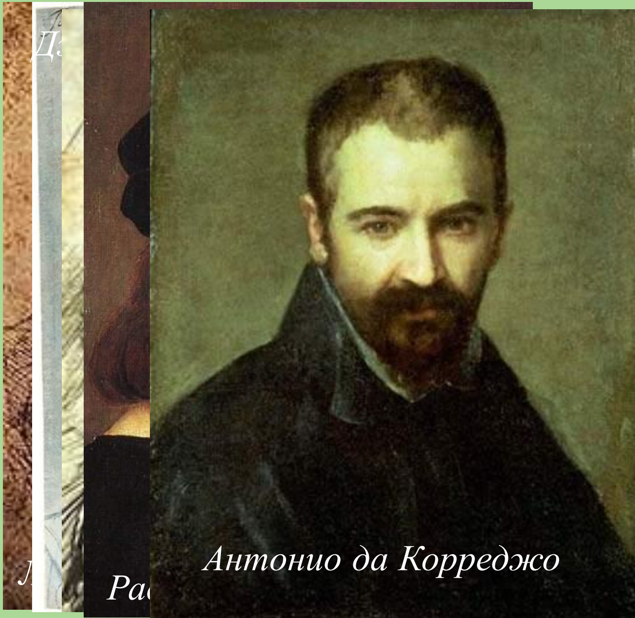
Антонио да Корреджо