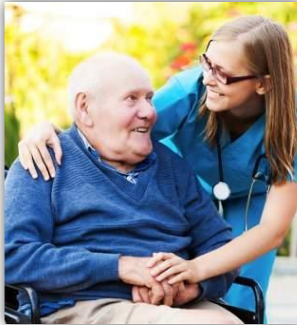
ДЕМОГРАФИЧЕСКАЯ СТРУКТУРА ОБЩЕСТВА