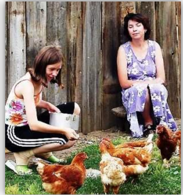
ТЕРРИТОРИАЛЬНАЯ СТРУКТУРА ОБЩЕСТВА