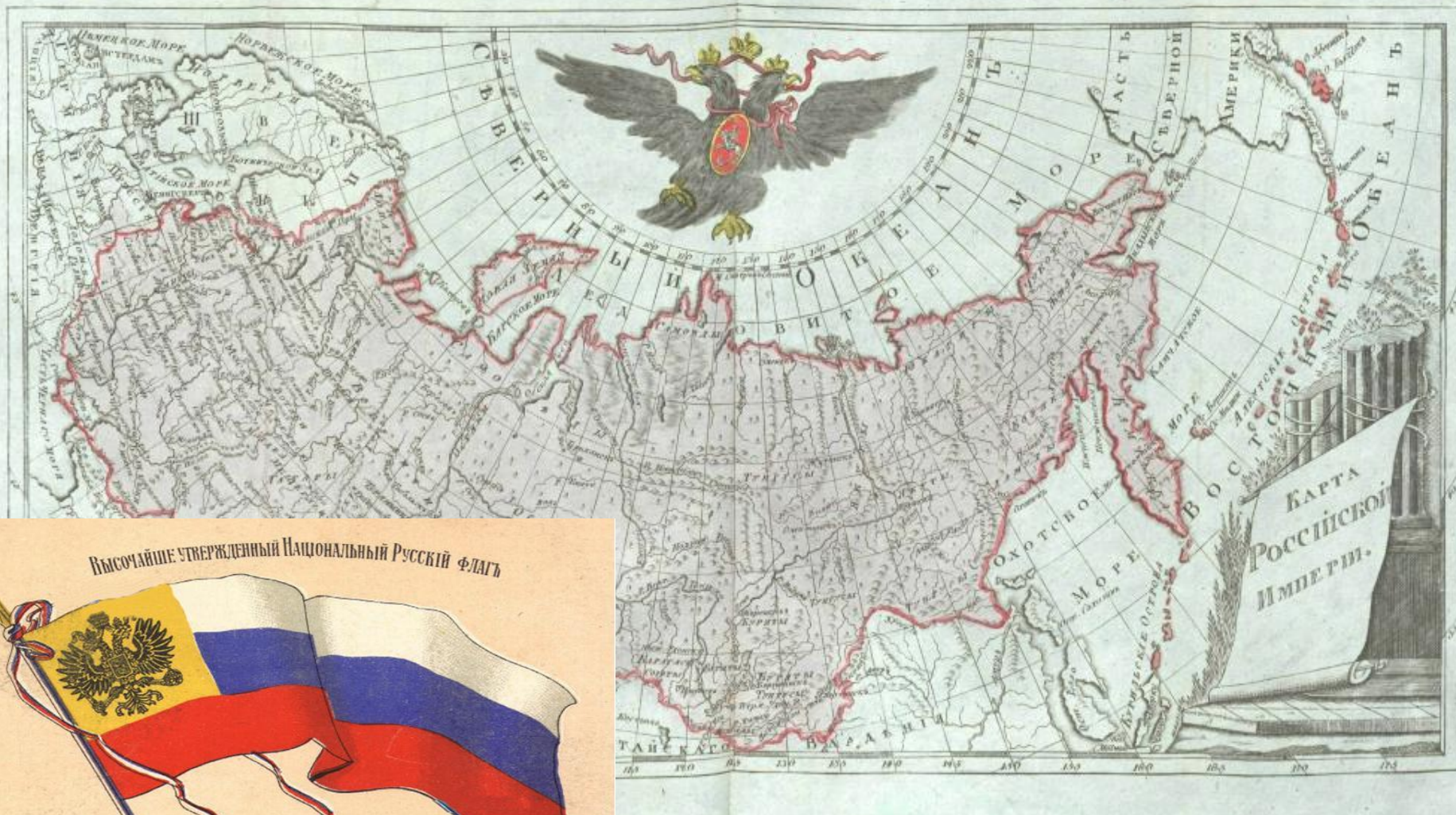
Высочайше утверждённый Национальный Русский флаг