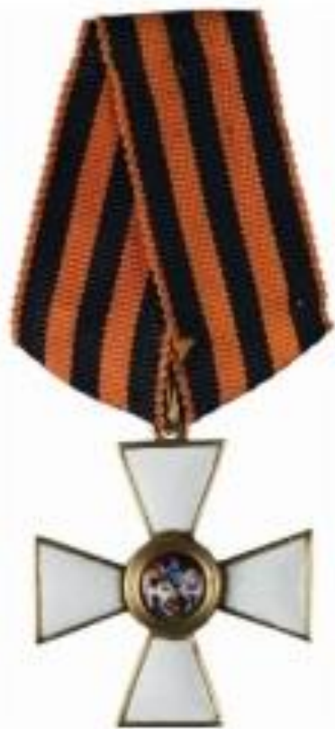
КАВАЛЕРОВ ОРДЕНА СВЯТОГО ГЕОРГИЯ