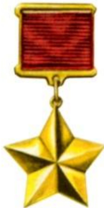
ГЕРОЕВ СОВЕТСКОГО СОЮЗА