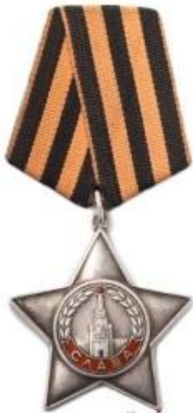
КАВАЛЕРОВ ОРДЕНА СЛАВЫ