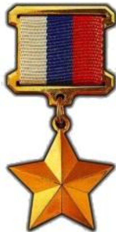
ГЕРОЕВ РОССИЙСКОЙ ФЕДЕРАЦИИ