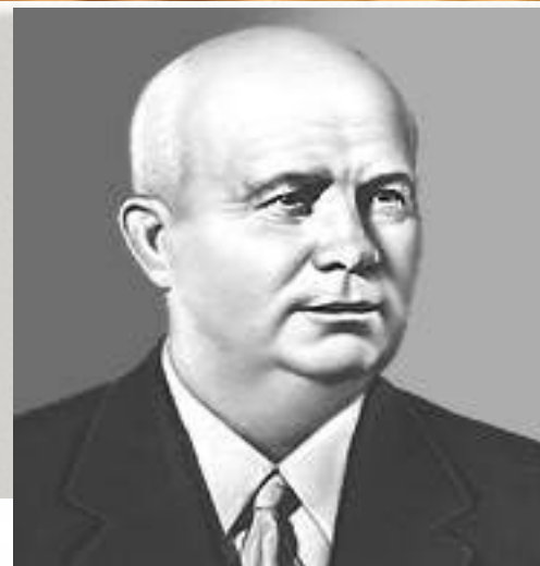
0 Н. С. Хрущев (секретарь ЦК КПСС)