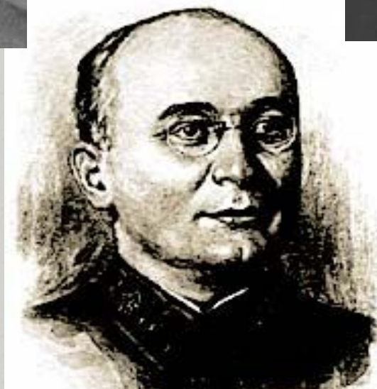
Л. П. Берия (руководитель МВД и внутренних войск)