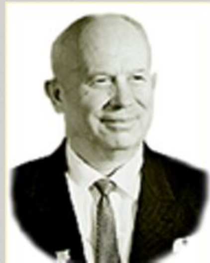
Н. С. Хрущев