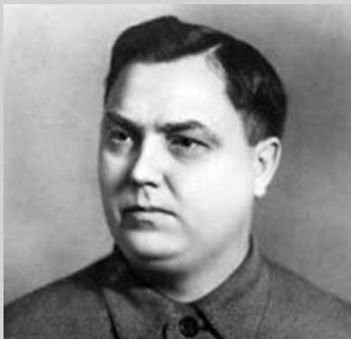
0 Г. М. Маленков (Председатель Совета министров)