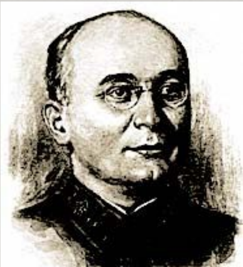
Л. П. Берия